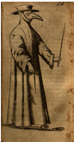
Figura 1 – ‘Médico da Peste’. 10

As roupas e pertences das vítimas, consideradas contaminadas, eram queimadas. Os chamados “médicos da peste” usavam capas longas para proteção e máscaras em forma de bico em que este continha substâncias aromáticas para bloquear o cheiro pútrido dos cadáveres em decomposição (Figura 1). 8