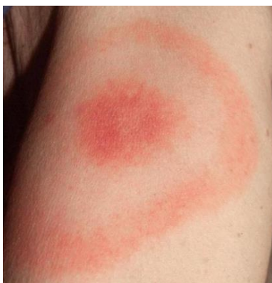
Figura 3 – ‘Lesão alvo’. 18

Estes sinais e sintomas variam de acordo com as espécies específicas e, portanto, com as regiões geográficas, dificultando o diagnóstico. 19