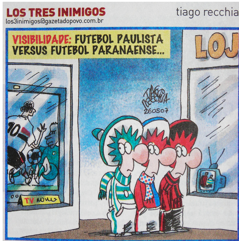
(RECCHIA, 26/05/2007: 1)

preto e vermelho) olham de soslaio para as agremiações paulistas: São Paulo (branco, preto e vermelho) e Palmeiras (verde), que atuam em uma tela significativamente maior do que a destinada ao futebol paranaense. Trata-se de uma desigualdade relacionada à disparidade regional brasileira e à existência de um “Norte-interno”, cujo centro é o Sudeste, que sustenta dinâmicas de poder e exploração com outras áreas geográficas, inclusive no futebol.