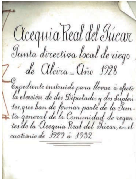
Document de l'any 1928 de la Junta Local de Reg de la Sèquia Reial del Xúquer.

Les juntes locals de cada poble s'ocuparen d'administrar l'aigua en els seus termes i es comportaven com les empreses gestores dels canals secundaris. En aquests canals les oligarquies locals tenien un paper determinant, ja que es concedia sols la meitat dels vots als propietaris urbans (Calatayud 2006: 60). Els termes municipals que pertanyien a la Comunitat, de fet, podien ser molt diferents entre ells, no sols pels privilegis concedits, sinó, per exemple, pel tipus d'agricultura. Podien ser productors d'hortalisses