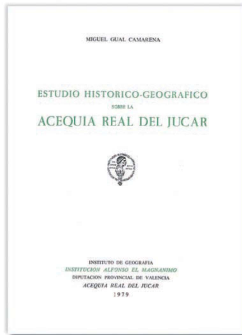
Portada del llibre Estudio Histórico-Geográfico sobre la Acequia Real del Júcar de Miguel Gual Camarena, 1979.

La Sèquia d'Alzira se ha imposat com un dels exemples històrics de la gestió comunitària de les aigües. Estudis geogràfics, entre els quals destacà Jaubert de Passa (1884) qui va assenyalar aquest canal com un dels més bonics d'Europa, i altres obres literàries, com la famosa novel·la de Vicente Blasco Ibáñez Entre naranjos (1900), han creat el tòpic d'un territori fecund, irrigat gràcies a la sapiència hidràulica dels camperols locals. Algunes cròniques, com les de Miguel Gual (1979) o Rafael Tasso (1945), han contribuït a consolidar el mite d'una entitat basada en l'administració democràtica i col·lectiva del reg. Efectivament, les