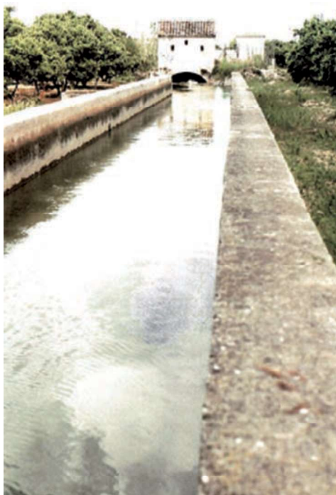
Braçal d'Alzira al seu pas per Benimuslem. (Camins d'aigua. El Patrimonio hidráulico valenciano. La Acequia Real del Júcar, dir. Enric Guinot, 2000)

Al marge del Sindicat Vertical, les comunitats de regants actuaren com a interlocutores del Ministeri d'Obres Públiques i els usuaris de les aigües del Xúquer proposaren i finançaren la construcció del Pantà d'Alarcón en la província de Conca, inaugurat el 1975 34 . D'aquesta forma, els regants d'Alzira contribuïren, concretament, a la regulació de les aigües fluvials no sols a nivell local, sinó a la pròpia conca hidrogràfica de la qual es consideraven protagonistes (D'Amaro 2012). Els representants i agricultors d'Alzira, com els dels altres pobles de la regió, defensaren la propietat del Pantà d'Alarcón fins i tot quan aquest va ser involucrat en un projecte hidràulic de dimensions nacionals. Encapçalades per la Sèquia Reial del Xúquer, diverses entitats valencianes es van oposar a qualsevol subordinació del Xúquer al transvasament 35 d'aigües del Tajo al Segura, projectat en la dècada del 1970 pel règim franquista. A Alzira, a principis del 1968, la Germandat, la Junta Local de Reg i la Cooperativa "La Agrícola" enviaren escrits formals d'oposició a l'ús del Pantà d'Alarcón com a embassament de capçalera del transvasament i indicaren les seues preocupacions en torn a la utilització de les aigües del Xúquer per a abastir altres conques hidrogràfiques.