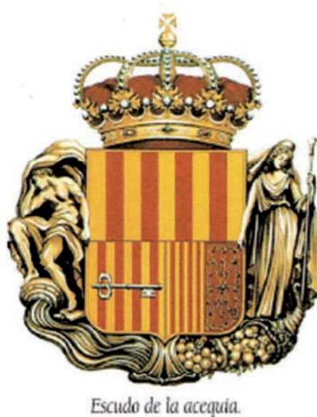
Imatge 8. Escut de la Sèquia Reial del Xúquer.