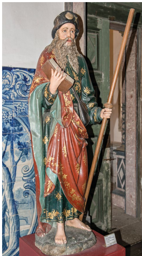
Fig. 7. Santiago , início do século XVI. Sé do Porto.

francês, juntamente com os restantes Apóstolos realizados para o mesmo espaço, oriundo, provavelmente, de uma escola normanda. Esta hipótese alicerça-se no cotejo entre as sobreditas esculturas concebidas para o portal da igreja do Mosteiro da Batalha e as imagens que foram esculpidas entre os séculos XIII e XIV para o portal da Catedral de Ruão, expostas hoje no deambulatório daquela igreja (Fig. 6).