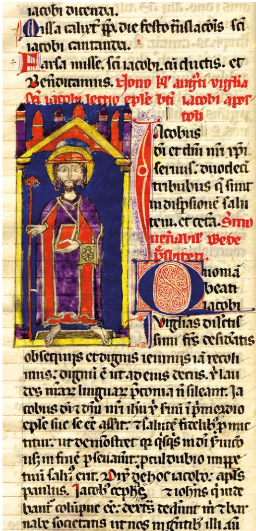
Fig. 4. Codex Calixtinus de Salamanca (Liber Sancti Jacobi) , c. 1325. Universidad de Salamanca, Ms 2631, fl. 2 v.

com o Santo descalço, nimbado, de chapéu (redondo), ostentando o livro mas também a bolsa, com o desenho da vieira, e o bastão em tau. Como Fernando Villaseñor Sebastián defendeu, grande parte das representações de Santiago, nos livros iluminados espanhóis de entre os séculos XIV e XV, seguem esta via de representação do Santo Peregrino 24 (Fig. 4).