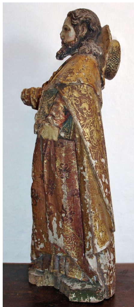
Fig. 11. Santiago , 1º quartel do século XVIII. Igreja de São Pedro, Évora Monte, ES.SP.1.016 1 Esc.

Peça de assinalável qualidade plástica, nela se destaca o detalhado tratamento fisionómico, em