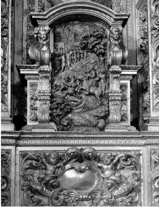
Fig. 21. Santiago Mata Mouros, 1726. Igreja de Santa Maria de Lamas, Santa Maria da Feira. Prov. Sé do Porto.

expressividade dos corpos (cada vez mais naturais numa primeira fase, até ao culminar do modelado barroco), na individualização dos rostos, na modernização dos atributos e das roupas, entre outros aspectos formais que permitem, de algum modo, datar as obras.