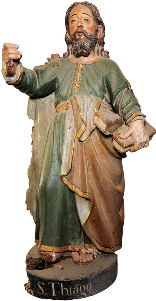
Fig. 19. Santiago , 2ª metade do século XVII. António de Almeida (atr.). Igreja do Salvador de Lufrei, Amarante, PND1.0002.

avulsas dos séculos XVII e XVIII terão um protagonismo residual nos altares das igrejas portuguesas.