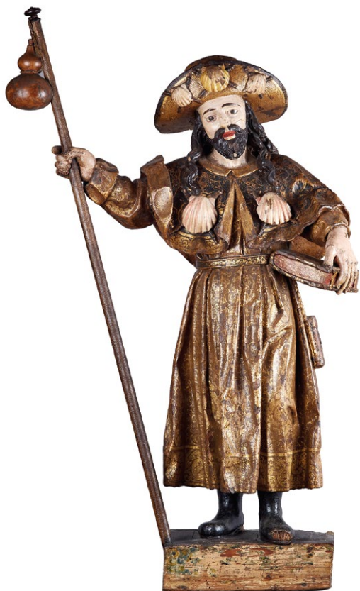
Fig. 12. Santiago , 2ª metade do século XVII. MNAA, 1506 Esc. Proveniente da coleção Ernesto Vilhena.

contraste com o longo manto estilizado, de pregas finas e rectilíneas. Integradas em semelhante contexto formal, merecem igualmente referência as elegantes esculturas das igrejas de São Gonçalo de Amarante, São Pedro de Évora Monte, ou Santiago de Torres Novas.