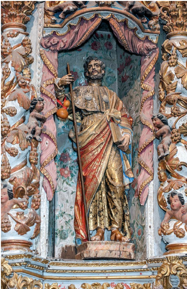
Fig. 16. Santiago , meados do século XVIII. Igreja de Santiago de Valadares, Baião, PSJ0.0001.

Incontornável, na abordagem à produção escultórica deste período, é ainda a referência aos ecos italianizantes, absorvidos desde há longos anos pelas múltiplas oficinas lisboetas de imaginária. Directamente transcritos, ou adaptados à estética de cada tempo, é matéria em que Joaquim Machado de Castro desempenhará um papel determinante. Autor de inúmeros modelos, executados depois em madeira por outros escultores, ilustra-o o pequeno barro resgatado entre os bozzetti da sua oficina. Proposta que parece filiar-se numa gravura de Francisco Vieira Lusitano — artista próximo