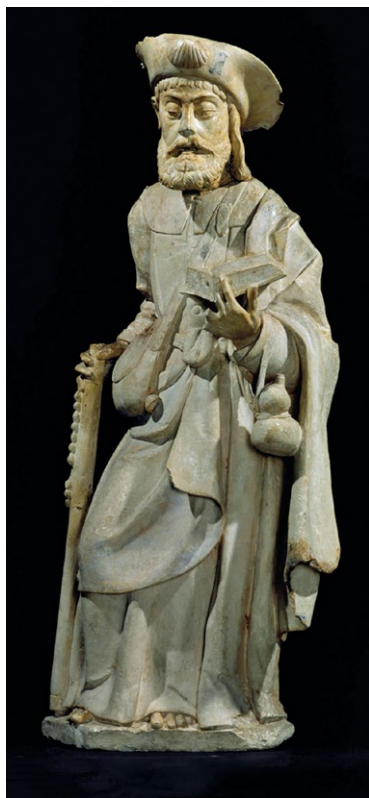
Fig. 9. Santiago , c. 1550. Aro do escultor coimbrão António Fernandes (II). MNAA, 949 Esc.

prendem a bolsa e a cabaça. Usa umas botas grossas, tal como o manto, que o aquece, sobre a túnica que não vai até aos pés, e um chapeirão onde se inscreve a vieira. Esta imagem certifica a objectividade da encomenda, que o queria peregrino ipsis verbis (ainda que não possamos saber quem terá pedido este trabalho) 29 .