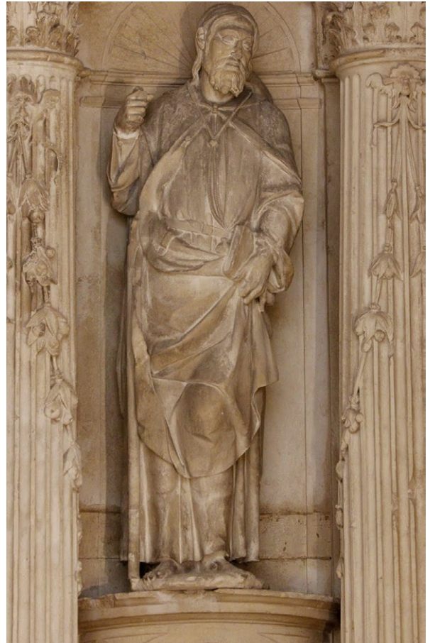
Fig. 10. Santiago , c. 1558-60. João de Ruão. Retábulo do Tesoureiro, MNMC, E 906.

Os primeiros documentos referentes à capela onde viria a construir-se este retábulo remontam a 1553 32 . Data de 12 de Dezembro de 1558 um recibo referente ao retábulo, assinado por João de Ruão 33 e, dias depois, em 30 de Dezembro, regista-se, na instituição da capela de Nossa Senhora da Assunção, que “no dia da invocação da dita capella dirão hua missa cantada que pasara pella que ouvera de ser rezada e outro tão farão no dia dos apóstolos Sâtiago e Sã João Evâgelista e Sã Johão Bautista e Sãto ãntonio, e na somana, ou no dia que çelebrarem de omnibus defunctis se me dira hua missa cãtada cõ vespervas e noturno por my e per meus deffumtos” 34 . Este dado informa sobre os sentidos da encomenda e justificam a presença da belíssima escultura de Santiago no retábulo de Nossa Senhora da Assunção (reimplantado no Museu Nacional de Machado de Castro, n.º E 906) que viria a terminar-se alguns anos depois, já em 1565 35 .