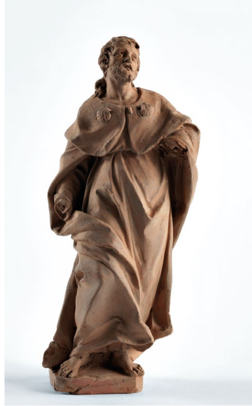
Fig. 18. Santiago , último quartel do século XVIII. Joaquim Machado de Castro, MNAA, 86 Esc.

do conimbricense e responsável pelo desenho de algumas obras de escultura — retoma, sem variantes assinaláveis, esquemas formais do barroco romano, concretamente na esfera de Camillo Rusconi 40 (Fig. 18).