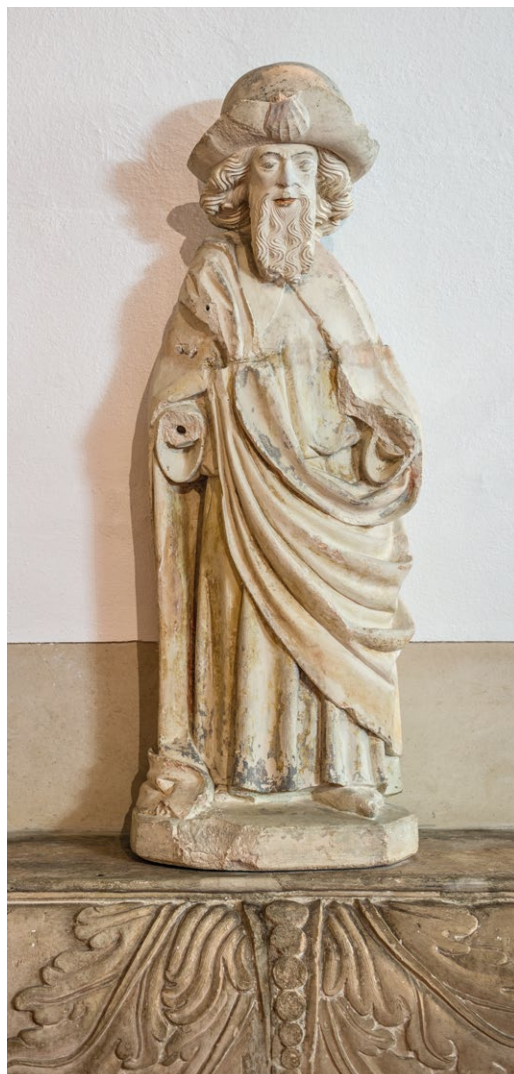
Fig. 5. Santiago , século XV. Matriz de Soure, Coimbra.

Assim sendo, esta imagem consubstanciará uma raridade maior, comparável à digníssima imagem togada do Mosteiro da Batalha, para integrar o Colégio Apostólico do portal da igreja (c. 1420-40), e que lhe pode ter servido de fonte. Também importa trazer à colação este belíssimo Santiago batalhino por representar um modelo