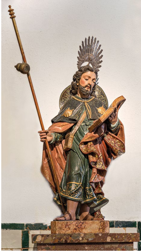
Fig. 17. Santiago , 2ª metade do século XVIII. Igreja de Santiago, Sesimbra.