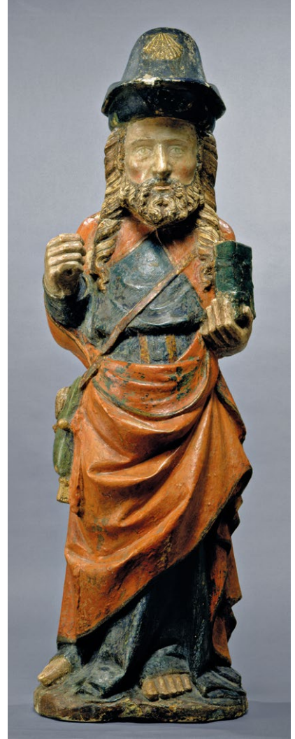
Fig. 1. Santiago , segundo quartel do século XIV. Irradiação da oficina de Mestre Pero. MNAA, 992 Esc.

De um modo geral, foi a partir das obras realizadas pelo designado Mestre Pero (c. 1300-1350), o escultor dilecto da Rainha D. Isabel de Aragão 16 , que se difundiu o gosto pela escultura isenta em Coimbra, espraído depois por um largo espectro de influência. Para o caso que agora importa, escolhamos a escultura de Santiago (Fig. 1) que subiste no Museu Nacional de Arte Antiga (Lisboa), proveniente do lugar de Avenal (Sebal Grande, Condeixa-a-Nova, Coimbra) 17 , incorporada na Coleção Ernesto Vilhena e, depois, doada pelos herdeiros ao Museu (n.º 992 Esc). Trata-se de uma escultura atribuída ao trabalho de Mestre Pero, ou ao seu aro de influência e irradiação formal, que permite avaliar sobre a antiguidade dos modelos plásticos que se disseminariam, com as devidas adaptações às modas visuais vigentes, até ao final do século XV — como de resto aconteceria com outras imagens escultóricas que propagaram modelos formais, devidamente acomodados às alterações estéticas e técnicas impostas pelo tempo, como o caso de alguns trabalhos do conhecido