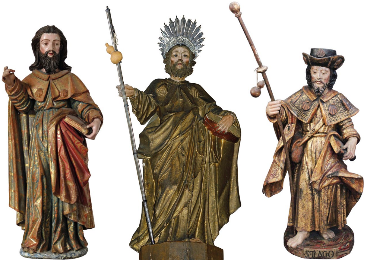
Fig. 13. Santiago , 1ª metade do século XVIII. Mosteiro de Alcobaça, 23 Esc.