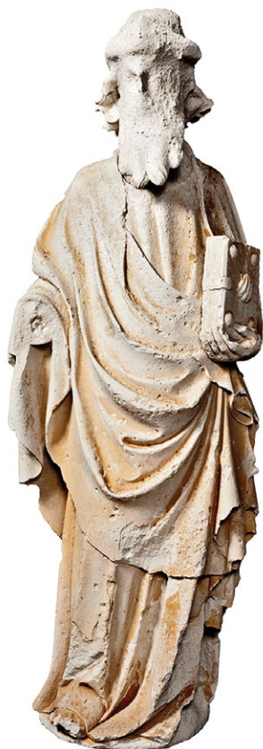
Fig. 6. Santiago, c. 1420-1440. Mosteiro de Santa Maria da Vitória, Batalha, Museu da Batalha | Centro de Interpretação, MB9. Proveniente do portal principal da igreja.