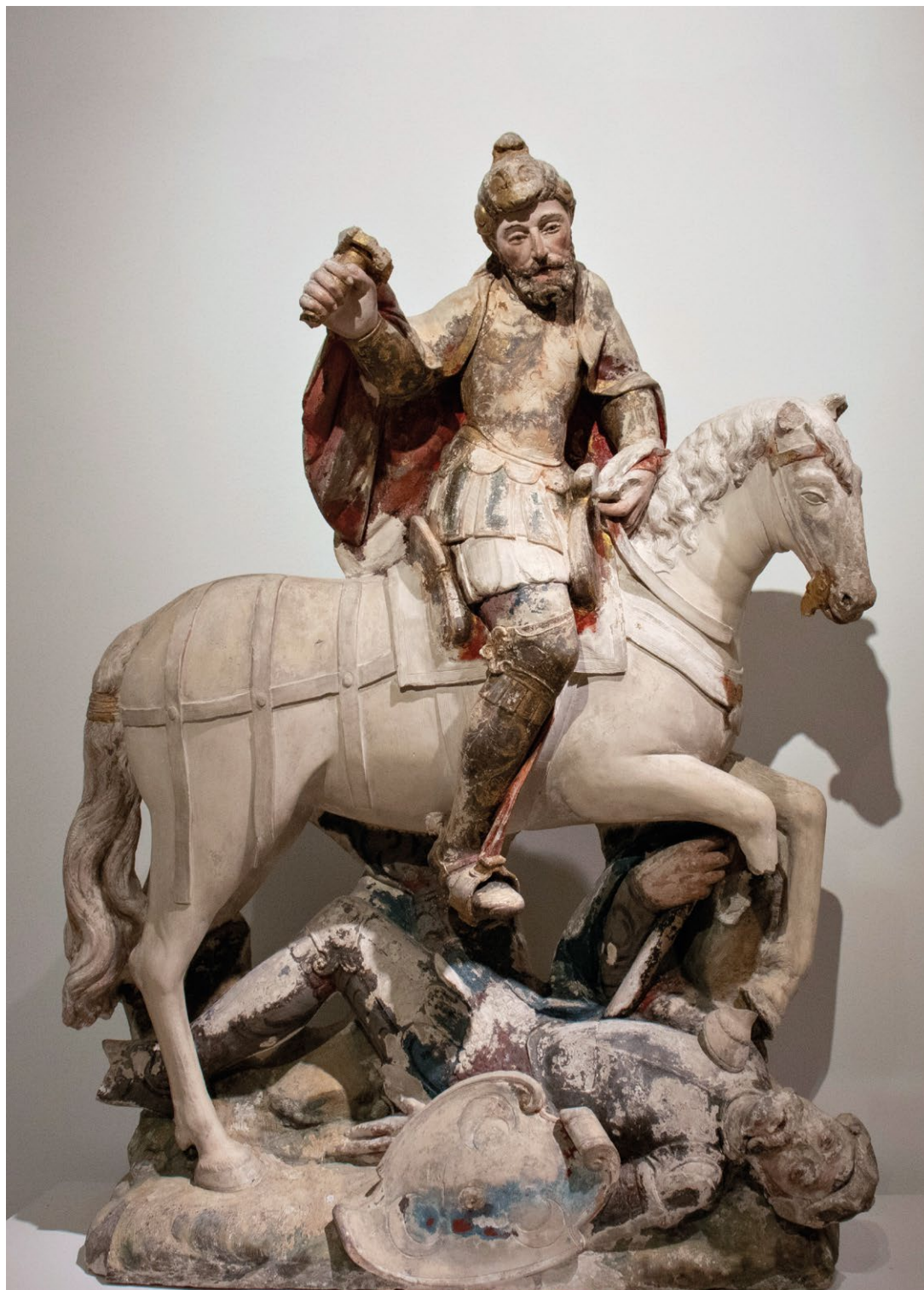
Fig. 20. Grupo de Santiago Combatendo os Mouros , c. 1540-50. MNAA, 982 Esc.