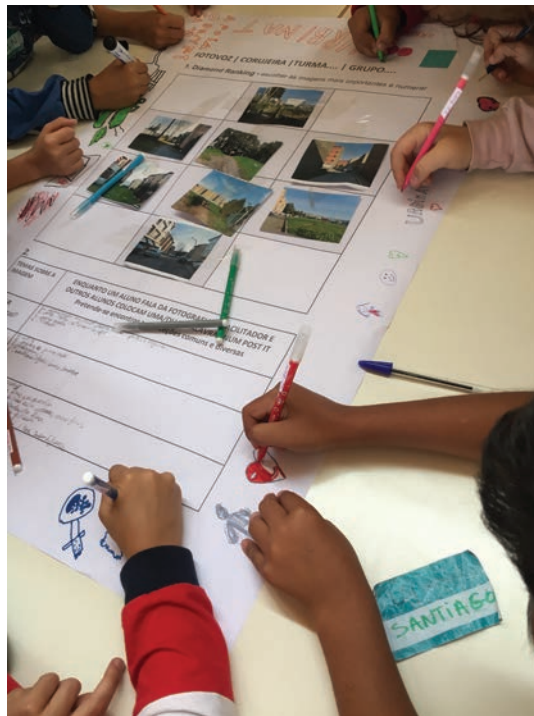
Foto 4. Atividade nas escolas, Porto, 2019.