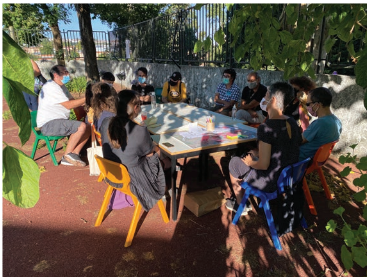
Foto 6. Atividade de participação com técnicos do setor público, Porto, 2020.