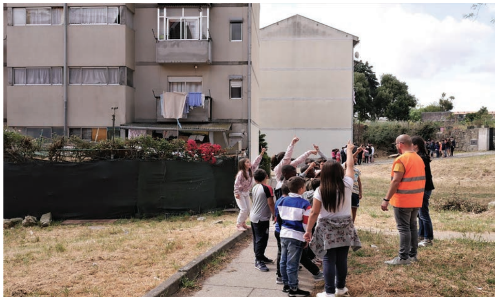
Foto 1. NBS de Participação, Walkthrough, Porto, 2019.