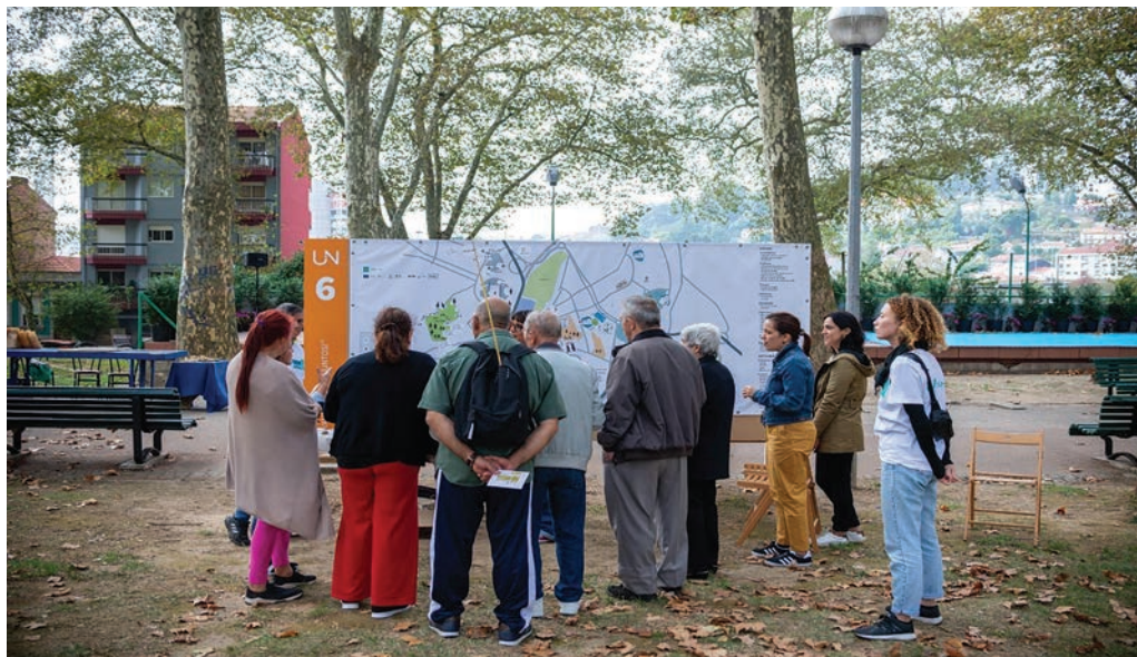
Foto 2. NBS de Participação, Cultural mapping, Porto, 2019.