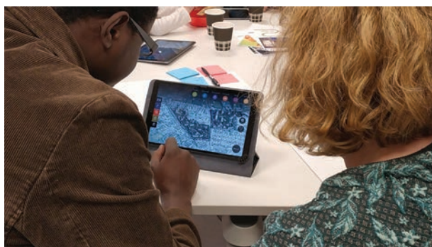
Foto 3. NBS Tecnológica, Superbarrio, Nantes, 2020.