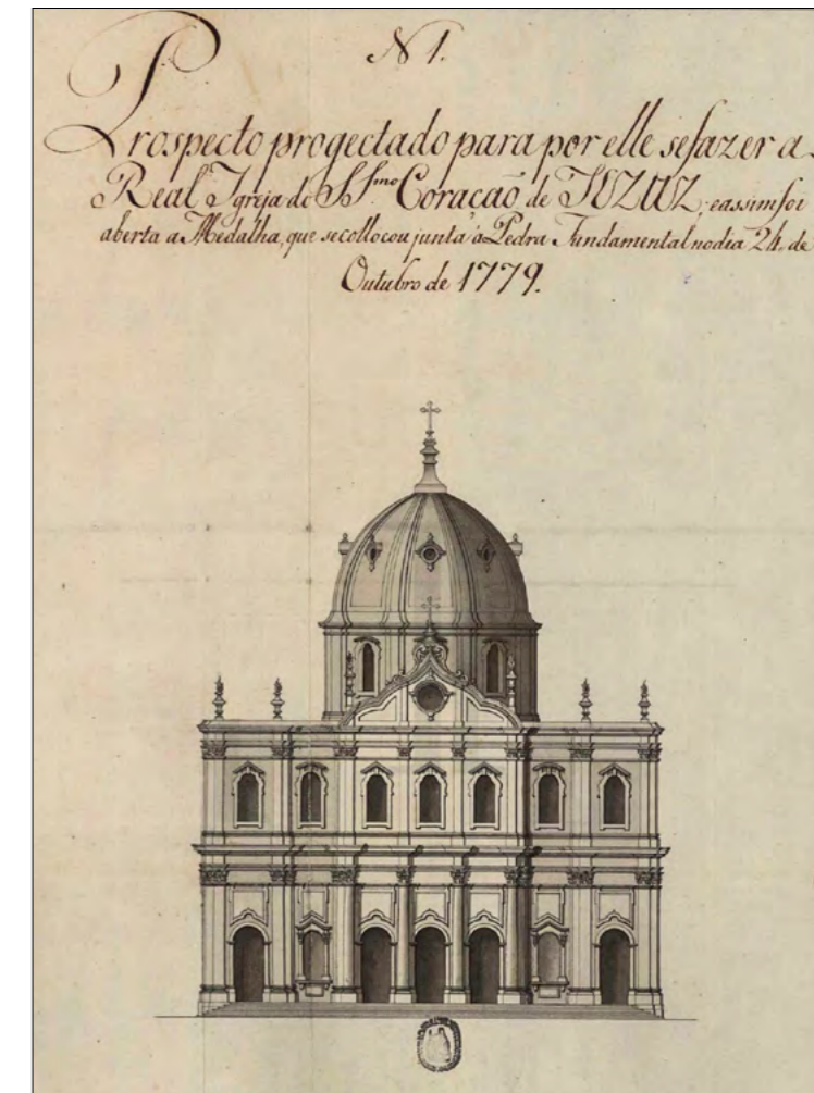
Fig. 5 Desenho do primeiro projecto para a fachada da basílica da Estrela ANTT - Ordem dos Carmelitas Descalços, Convento e Basílica do Santíssimo Coração de Jesus da Estrela. Liv. 1.

Datável de 1778 (portanto, sete anos posterior ao de Jesus), é marcado pela ausência de torres, e pela presença do típico frontão borromínico, substituído mais tarde por um outro triangular, mas recorrente em várias obras do arquitecto de Queluz. As causas da recusa, como se sabe, e respectiva substituição, poderão encontrar explicação na proximidade do empreendimento régio à mais modesta igreja franciscana, a escassos metros de distância. Apartada dos pressupostos utilitários da Baixa, a igreja de Jesus integra-se, tal como a Estrela, numa série de outros templos conventuais, filiados estruturalmente no modelo tradicional de São Vicente de Fora.