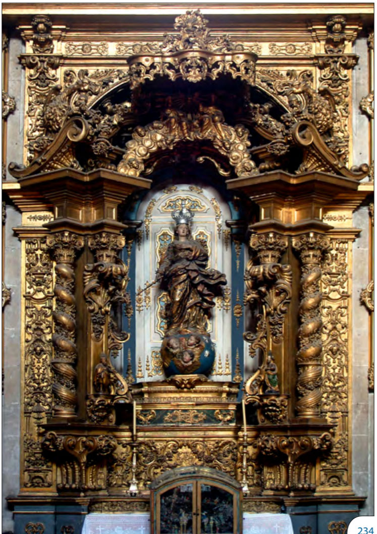
Fig. 6 Retábulo de Nossa Senhora do Patrocínio Igreja de Nossa Senhora das Mercês (Jesus).