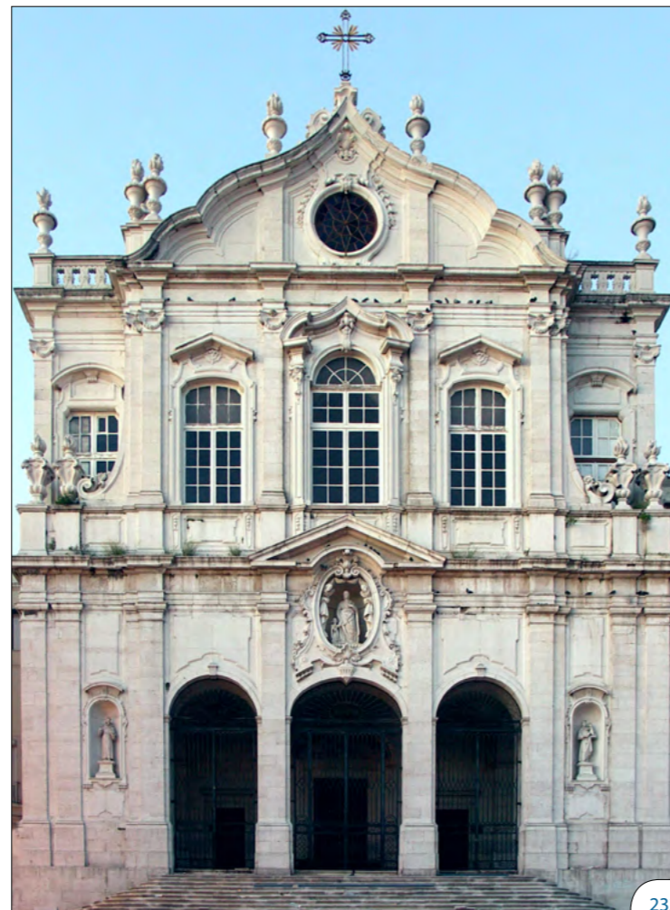
Fig. 3 Fachada da igreja de Nossa Senhora das Mercês (Jesus)

Fruto das diversas circunstâncias que marcaram a sua encomenda, a renovada igreja de Jesus resultaria, assim, numa interessante articulação entre arquitectura rococó e pombalina. Com uma das mais emblemáticas fachadas da Lisboa reconstruída, emerge como uma iniciativa à margem da programática vigente, seja pelos seus contornos estilísticos, seja pelo carácter privado de que se reveste. Por explorar, permanece a inequívoca filiação deste modelo com o primeiro projecto concebido para a basílica da Estrela (corpo central), da autoria de Mateus Vicente de Oliveira.