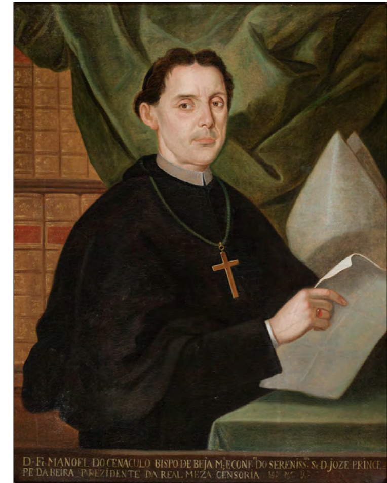
Fig. 1 Retrato de Fr. Manuel do Cenáculo, c. 1770-77 Óleo s/ tela. Colecção de Pintura da Biblioteca Nacional de Portugal (Inv. 10936).

se encontravam terminados os trabalhos na fachada do templo, mas em que prosseguiam ainda as obras na biblioteca ( Idem : 385 v.), verifica-se então um incremento de donativos e empréstimos, feitos por D. Maria I à Província, para pagamento dos mestres.