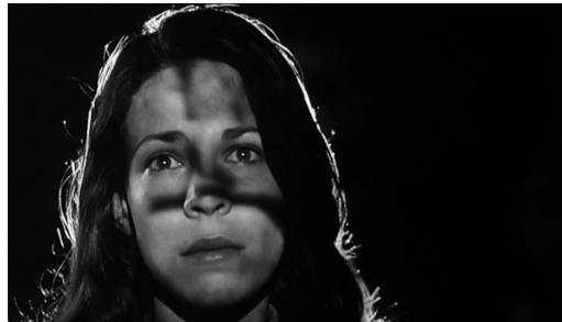
Fig. 1: The Addiction .

sociais e a nossa consciência da identidade» (Hall 2004: 134) (11) . Kathleen não é apenas um sujeito cartesiano racional, ela é verdadeiramente sujeita , isto é, ela existe no interior de relações sociais, discursos, interdições, e repressões que a sujeitam , tal como foram estudadas por Karl Marx, Michel Foucault, e Sigmund Freud. A alegoria é, neste contexto, um dispositivo que reflete a consciência ideológica do filme usando meios auto-reflexivos. O uso da voz de Kathleen como narradora, em particular, cria um estrato que não é estritamente dependente da imagem, não sendo um comentário sobre as cenas nem uma maneira de transmitir mais informação narrativa. Trata-se de uma expressão da sua busca pelo conhecimento e pela sabedoria que gera outro nível de significado e fratura a literalidade do mundo ficcional. Este é um uso alegórico frequente que serve «para dilatar ou condensar significados exactamente como os tropos fazem em poesia» (Honig 1966: 4) (12) .