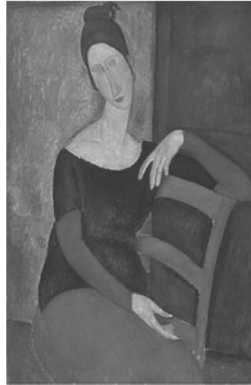
Figura 3 – Amedeo Modigliani, Retrato de Jeanne Hébuterne (1918)