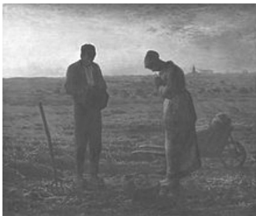
Figura 5 – Jean-François Millet, Angelus (1859)

uma leitura capaz de estimular uma oportuna discussão sobre o trajeto da própria protagonista do conto: