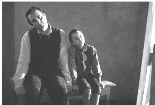
Figura 4 – Fotograma de Modigliani , de Mick Davis (2004):

Por outro lado, a preferência de Modigliani pelo retrato de figuras com o olhar vazio pode ser o ponto de partida para extrapolações acerca da protagonista do conto, a quem é atribuída uma identidade instável e flutuante, um percurso de vida acidentado no campo dos relacionamentos e uma dificuldade de focagem 14 e de adesão à realidade que a observação de alguns quadros permite iluminar de forma muito direta. Uma forma de propor aos alunos essa associação de forma imediata é a exibição do filme (ou partes do filme) Modigliani , de Mick Davis (2004). Embora com limitações estéticas e algumas incongruências históricas, o filme permite, no essencial, o estabelecimento de uma comparação entre o seu protagonista e a protagonista do conto, tanto nos aspetos que os aproximam, como naqueles que os distanciam, nomeadamente no que respeita à consideração da pintura como forma de enriquecimento, um assunto que o conto debate no final e que o filme explora através de uma curiosa conversa entre Modigliani e Renoir. Também em termos de técnica narrativa é possível estabelecer diálogos entre o conto e o filme, visto que em ambos se recorre à sobreposição, no mesmo segmento narrativo, de figurações ou idades diversas da mesma personagem, o que facilita, na didática do conto, a perceção do complexo arranjo discursivo que acompanha a também imbricada construção da figura: