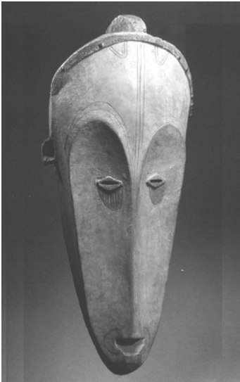
Figura 2 – Máscara de madeira da etnia Fang (Gabão)

Embora as possibilidades de articulação a este nível sejam muitas 12 , o caso de Modigliani impõe-se pelo facto de ser uma referência explícita da personagem e também por haver na sua obra elementos que permitem ilustrar o tema da representação do outro: o trabalho pictórico e escultórico de Modigliani realiza uma inquirição sobre a representação do feminino em que há lugar para a inclusão de elementos figurativos exteriores ao europeu, provenientes, por exemplo, da arte primitiva africana 13 :