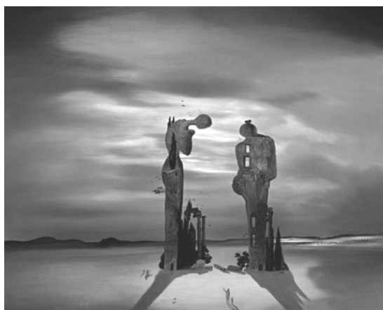
Figura 6 – Salvador Dalí, Reminiscência arqueológica do Angelus de Millet (c. 1918)

A convocação de Dalí neste ponto faria ainda sentido por permitir, através da pintura, ilustrar um traço de George que é apresentado pelo narrador como um seu fetich e: as gavetas.