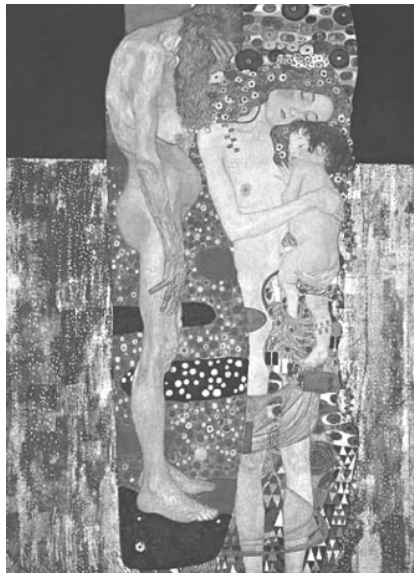
Figura 1 – Gustav Klimt, As três idades da mulher (1905)

que nos projeta no tempo e no espaço e responsabiliza cada indivíduo único pela emissão de uma pluralidade de sombras e de vozes (a inescapável alteridade que a nossa aparente unidade identitária oculta 7 , como os alunos deste ano curricular têm oportunidade de estudar a propósito da leitura de Fernando Pessoa), poderá partir da recuperação da leitura (literária 8 ou fílmica) de um objeto como A Christmas Carol de Charles Dickens 9 ou da apreciação crítica de uma pintura como As três idades da mulher de Gustav Klimt 10 , um objeto capaz de suscitar interessantes atividades de escrita e de expressão oral, nomeadamente o debate ou o diálogo argumentativo: