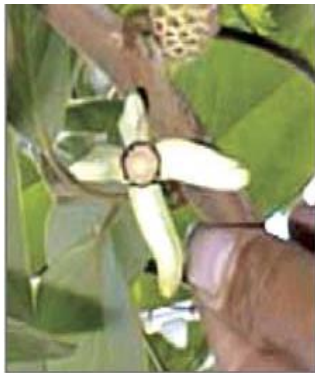
Figura 3 – Flor de Annona cherimola (8)