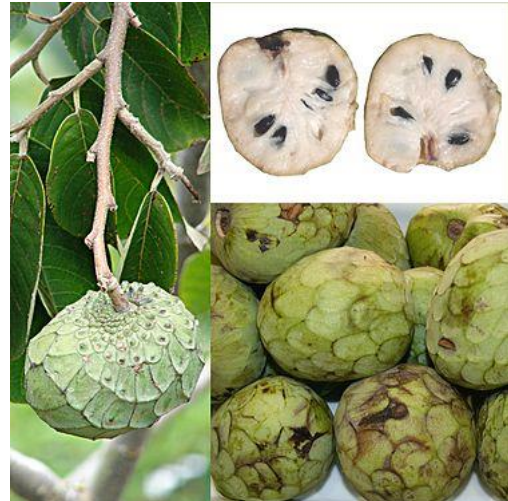
Figura 2 – Anona (10)