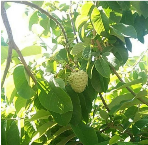
Figura 1 – Annona cherimola Mill