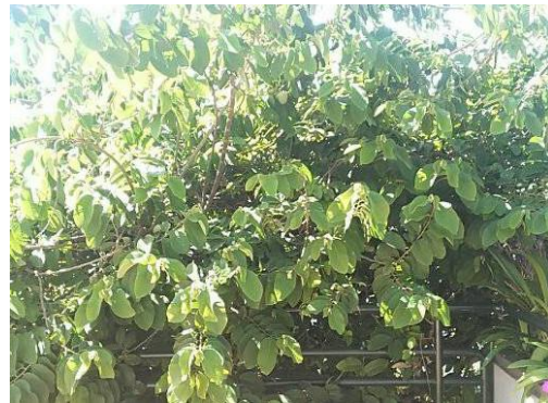
Figura 4 – Ramificações de Annona cherimola Mill.