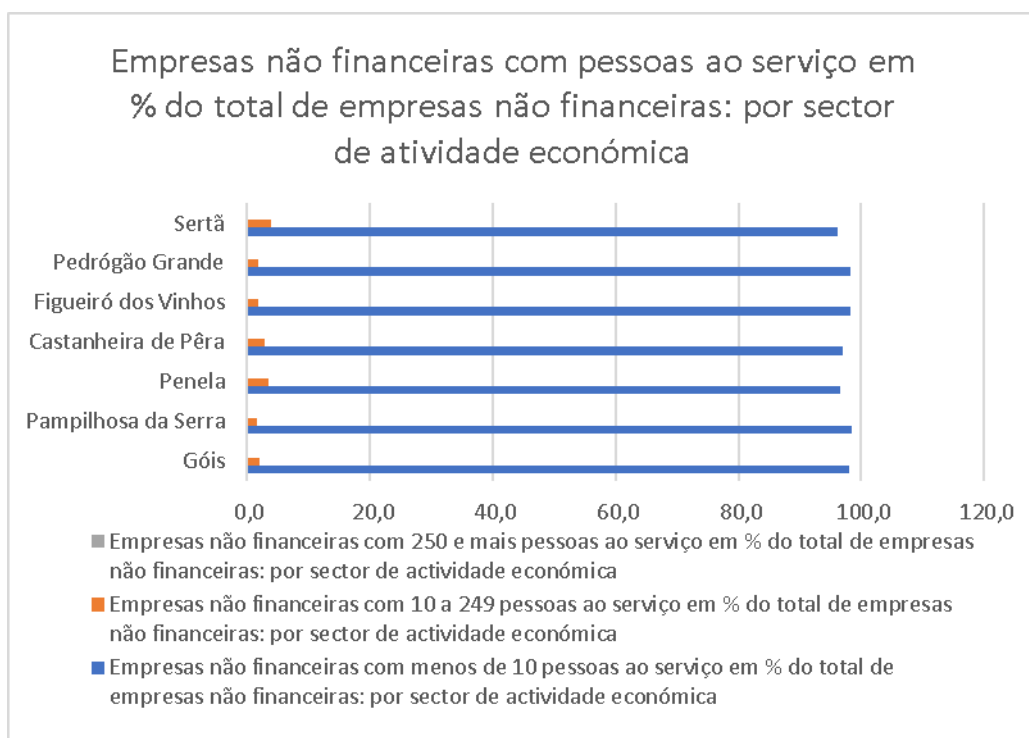
Figura 2: Empresas não financeiras com pessoal ao serviço em % do total de empresas não financeiras por sector de atividade económica

No que toca às empresas não financeiras com 10 a 249 pessoas ao serviço em % do total de empresas não financeiras: por sector de atividade económica, estas representavam 2% do número total de empresas em Góis, 1,5% em Pampilhosa da Serra, 3,5% em Penela, 2,9% em Castanheira de Pera, 1,7 em Figueiró dos Vinhos, 1,8% em Pedrógão Grande e 3,8% na Sertã.