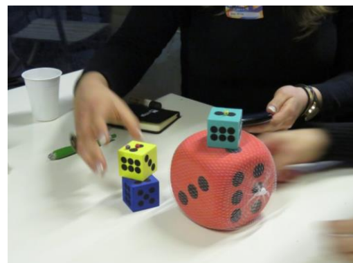
Anexo 3. Prémios do quizz no dia internacional dos dados abertos.

Fonte: http://www.transparenciahackday.org/2017/03/como-foi-o-open-data-day-2017/ . Consultado a 21/06/2017