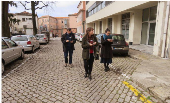
Anexo 1. Grupo de que fiz parte a mapear uma das ruas da cidade do Porto.