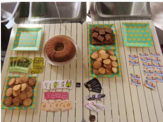
Anexo 4. Mesa de receção no dia internacional dos dados abertos.