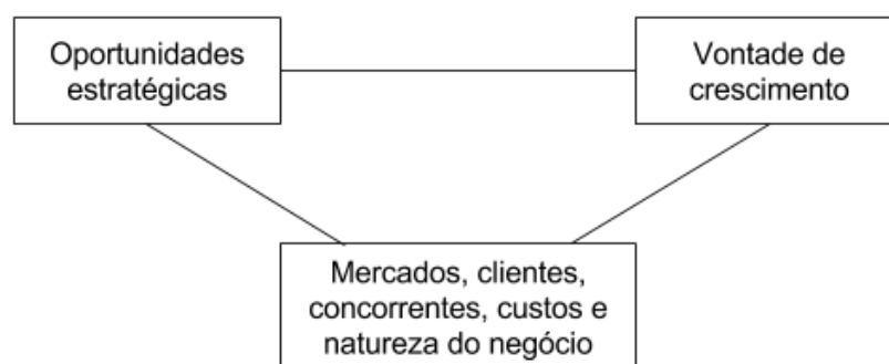
Figura 4 - Principais grupos dos motivos para a internacionalização (adaptado de Viana e Hortinha, 2007).

Segundo Hortinha e Viana (2007), em relação aos fatores relacionados com a oportunidade estratégica surgem: a imagem do país de origem da empresa, pois a ideia que os outros países têm de um país pode ser decisiva no momento da compra de produtos, sendo que algumas empresas deslocam a parte final da produção de um produto para um geográfico e cultural, havendo uma tendência a expandir para países geograficamente e