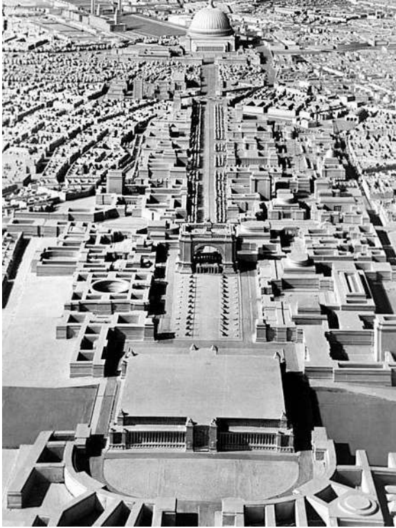
Fig. 5 – Fotografia do Modelo para Berlim, plano de A. Speer 36

seria a praça de entrada na CUC, a Praça D. Dinis, proporcionavam um impedimento topográfico pela grande diferença de cotas 35 .