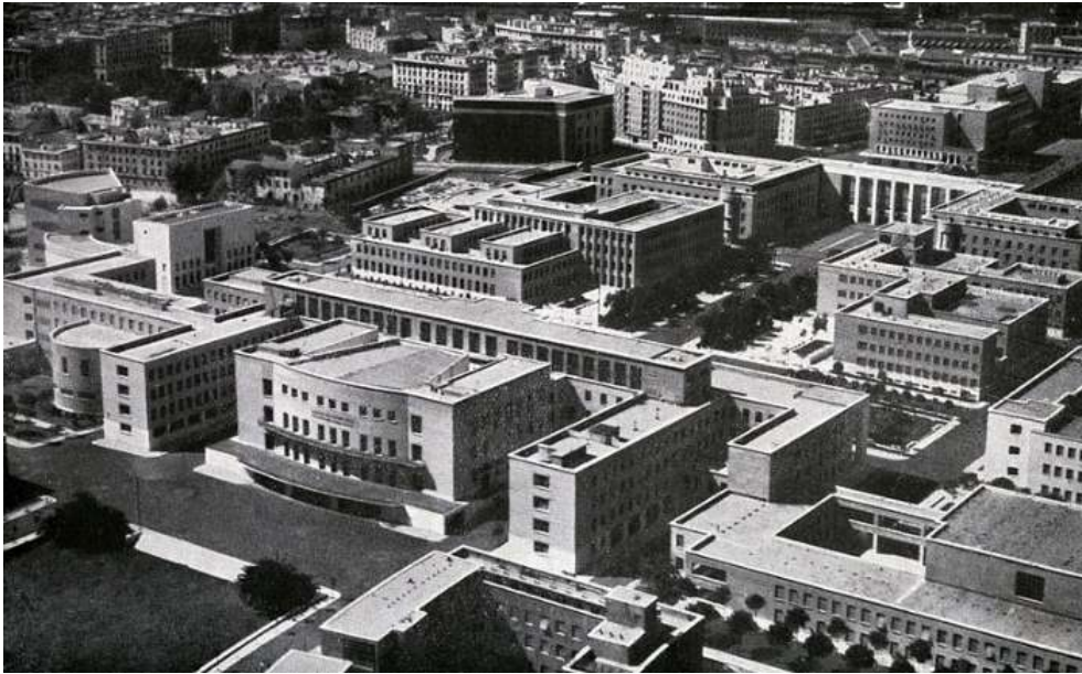
Fig. 4 – Vista aérea da CUR 31