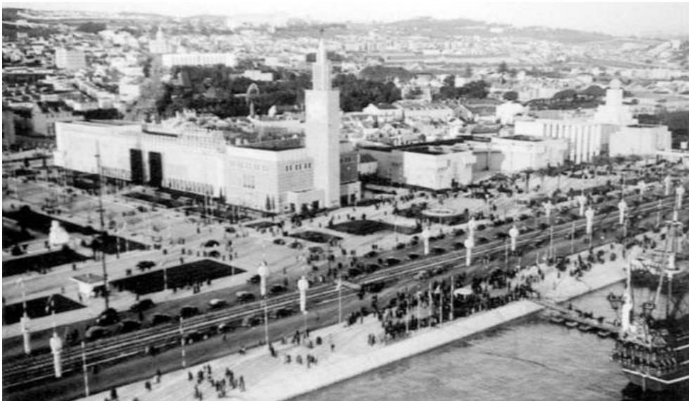
Fig. 2 – Exposição do Mundo Português, 1940 24 .