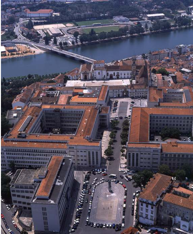
Fig.1 – CUC. 14