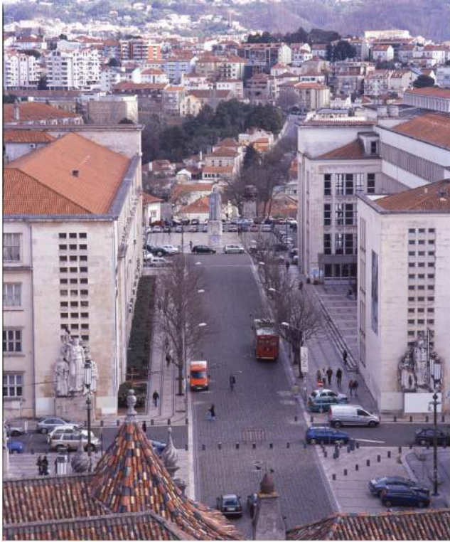
Fig. 6 – Vista sobre a Rua Larga. 37