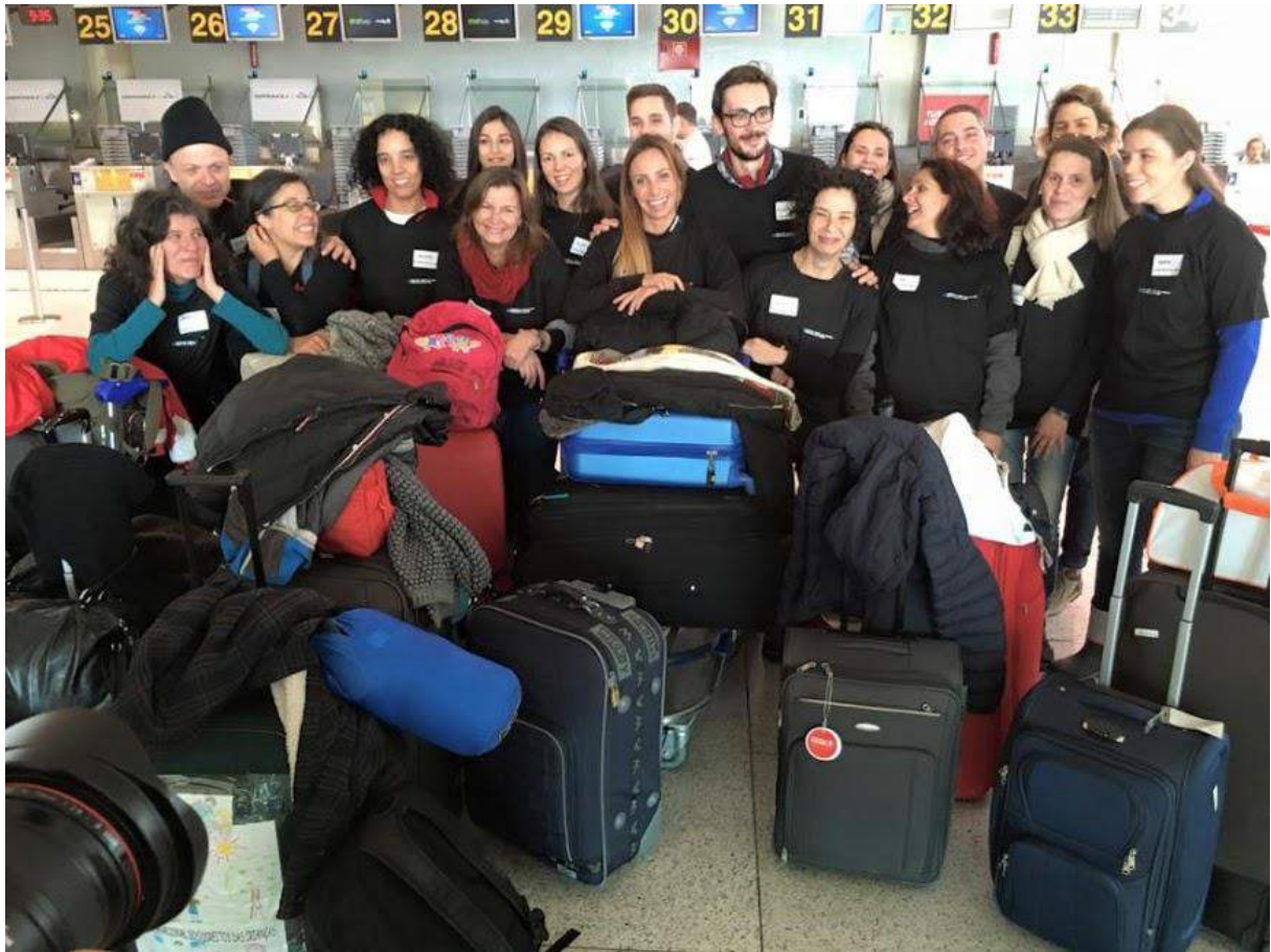
Fig. 2. Grupo de Voluntários/as da Caravana da Esperança . Dezembro de 2015.

Levamos connosco mapas da Europa, com Portugal assinalado. Quando não sabiam falar inglês (o que era raro), dávamos-lhes para a mão um papel traduzido para árabe, onde explicávamos onde ficava Portugal e como tinham de fazer para pedirem asilo. A uma dada altura fomos avisados para não mostrarmos mais o mapa e o papel, pois se fôssemos apanhados pela polícia ou militares poderíamos ser presos ou postos fora do campo sem poder trabalhar.