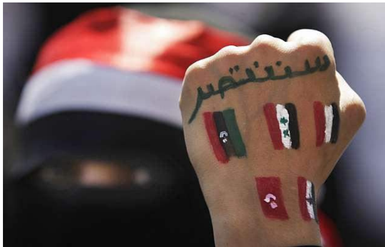
Fig. 1. Imagem alusiva à Primavera Árabe.

Uma onda de revolta contra os governantes e a opressão causada pelos mesmos à comunidade levou à formação de grupos de rebeldes. Estes iniciaram a sua organização, levando a cabo ataques com o objetivo de destituir o governo do seu país. A este movimento revolucionário foi dado o nome de “Primavera Árabe”, que aconteceu no Médio Oriente e no Norte de África. Tunísia, Egipto, Líbia e Iémen foram os países que viram o seu objetivo alcançado, todos os quatro viram os seus governantes destituídos, dando início a uma reforma política. Contudo, outros tantos governos acabaram por ficar intactos, como no caso do Iraque, da Síria, de Omã e de Marrocos.