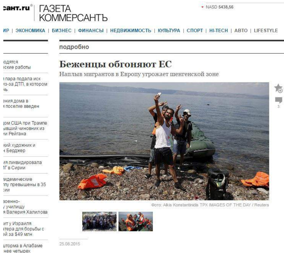
Fig.4.1. “Os refugiados ultrapassam a UE” (Kommersant, 25.08.2015, 1ª foto da série;).

O encarar os/as refugiados/as como migrantes é explorado nas duas fotografias da série (Figuras 4.1 e 4.2). A fotografia de abertura (Fig. 4.1) mostra três homens numa praia vestidos de calções, t-shirts e chapéus a tirarem uma selfie com os telemóveis e a fazerem o sinal de vitória. O momento capturado pelo autor da fotografia é de felicidade e de celebração. Pelo tipo de roupa, dos gestos e dos movimentos, pode-se chegar à conclusão que os homens são turistas. Apenas os objetos na foto – as manchas coloridas dos coletes de salvação e o barco insuflável por detrás – indicam um cenário bem diferente, apontando para a travessia pouco segura do mar até conseguirem essa vitória.