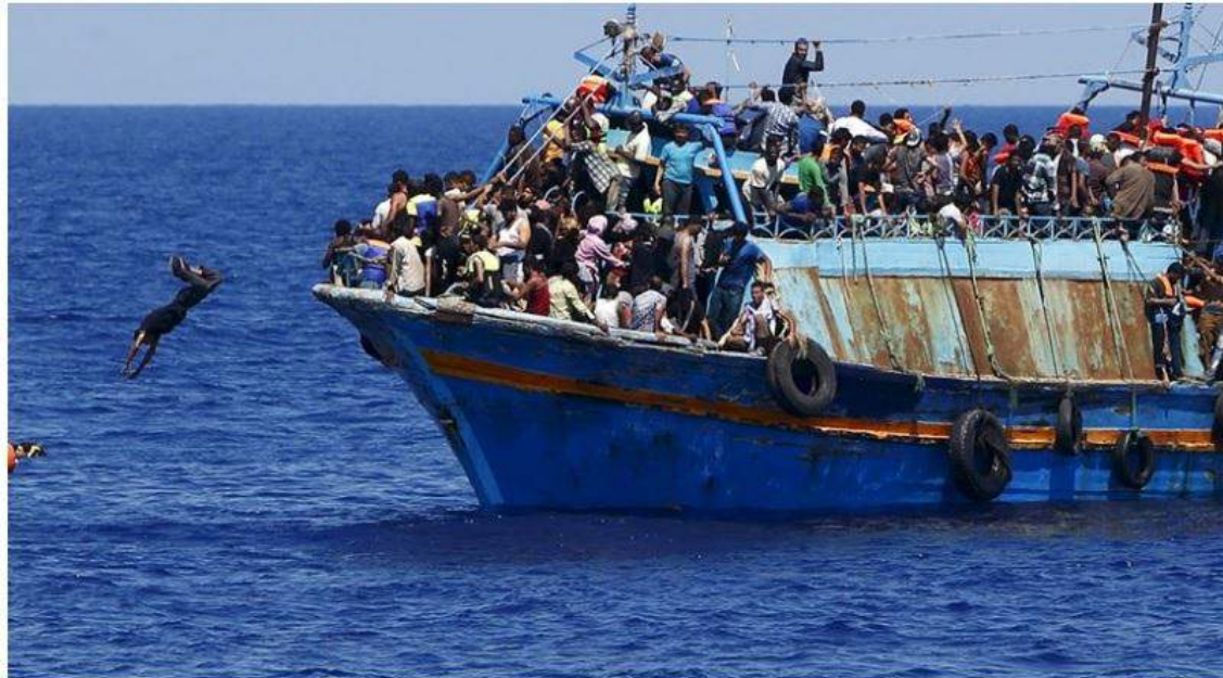
Barcos no Mediterrâneo tentam chegar à costa da Europa