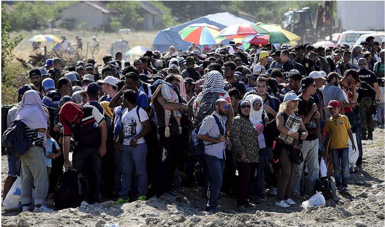
Fig.4.2. Kommersant, 25.08.2015, 2ª foto da série.

A próxima fotografia da série (Fig. 4.2) retrata uma multidão de pessoas de todas as idades, vestidas com roupas coloridas (calças de ganga, bonés, óculos de sol).