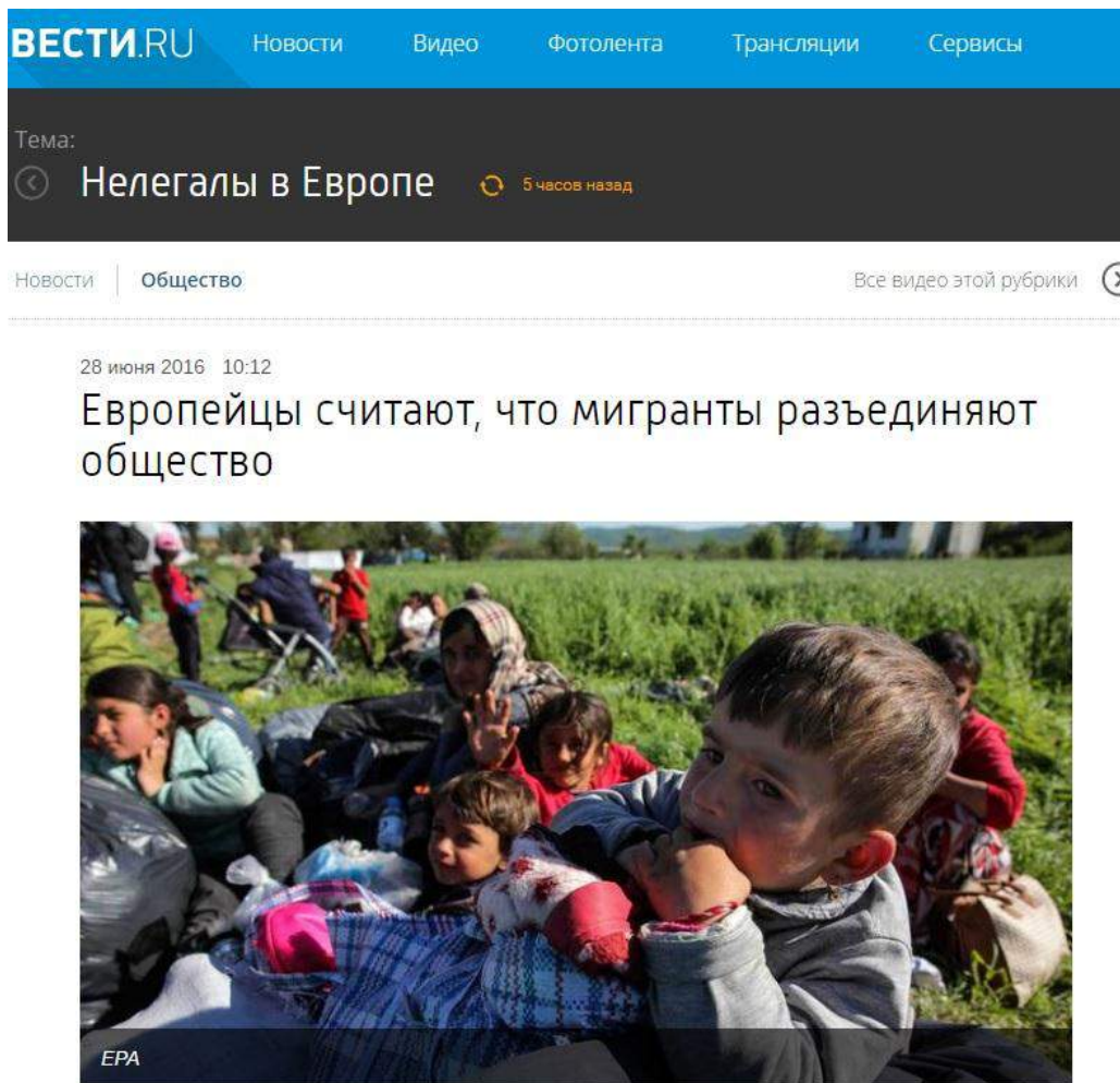
Fig. 7. “Europeus consideram que migrantes dividem a sociedade” (Vesti, 28.06.2016;).

A narrativa visual dessa fotografia, proveniente da agência European Press Photo , parece ser bastante semelhante à narrativa da fotografia da SIC-Notícias (Fig.6): o leitor vê muitas crianças rodeadas de sacos, sentadas no chão, a descansar num campo aberto. Os poucos adultos estão longe ou quase ocultos. Portanto, a mensagem visual pode igualmente ser de vulnerabilidade e de inocência. Se tomarmos em consideração a mensagem textual do título traduzido (“ Europeus consideram que migrantes dividem a sociedade ”), ficamos, entretanto, perplexos: os jornalistas russos não apenas evitaram o termo “refugiado”, como introduziram a ideia de falta de uniformidade na Europa perante a crise migratória. Ao quebrar o eixo associativo habitual entre as imagens de crianças e a inocência e a vulnerabilidade, os autores da notícia redirecionaram a atenção do leitor ao modo textual, que se refere aos resultados de uma sondagem de opinião lançada por um projeto internacional ( Sputnik.Polls [Sputnik.Opiniões] ) com parceiros nos países europeus e nos Estados Unidos. A sondagem, alegadamente, demonstrou que a maioria dos inquiridos no Reino Unido, França e Alemanha concorda que “são precisamente os migrantes que dividem a sociedade” (Vesti, 28.06.16). Entre os parceiros do projeto são citadas as empresas e institutos de pesquisa do mercado e da