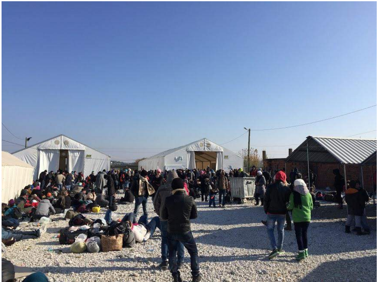
Fig. 1. Campo temporário de Gevgelija. Dezembro de 2015.

Se os funcionários estão cansados e em burnout, o que acredito que seja possível, as organizações responsáveis que substituam estas pessoas, para minorar o seu desgaste e para que esse mesmo desgaste não caia em cima de quem mais precisa deles.