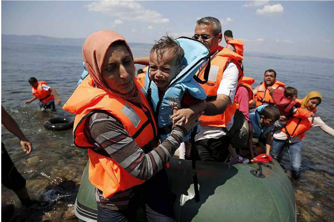
Fig.4.3. Kommersant, 25.08.2015, última foto da série.

As suas expressões faciais, gestos e linguagem corporal contam a história trágica da chegada à costa do Mediterrâneo. O cansaço, a dor, o choro e o desespero estão implantadas nas suas caras. O posicionamento dos corpos da mãe e da criança relembram a “ Migrant mother ” e, até, talvez, podem invocar as imagens icônicas de Nossa Senhora. Assim como na “ Migrant mother ”, os autores da fotografia procuraram ir além do concreto momento capturado, enfatizando os temas da maternidade, da vulnerabilidade e do futuro. Desta forma, as três imagens fotográficas da notícia no jornal russo constroem uma trajetória narrativa visual que começa por reexaminar a identidade dos/as refugiados/as e acaba reforçando a dimensão humanitária da crise de refugiados/as. Em resultado do seu desenvolvimento, o discurso visual complementa, desenvolve e chega a contrariar as mensagens do “influxo” e de “ameaça” expressas pelo modo textual.