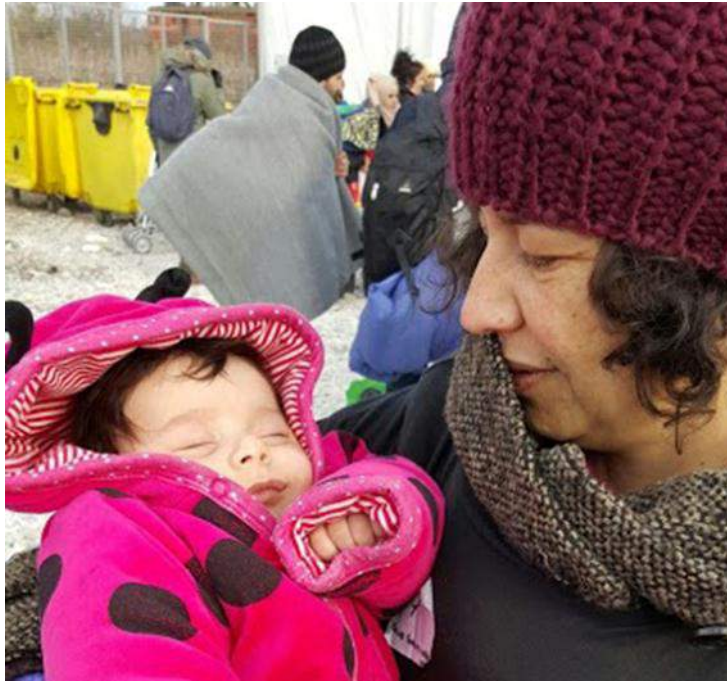
Fig. 3. Autora com uma criança. Campo temporário de Gevgelija. Dezembro de 2015.

Desengane-se quem alguma vez pensou que me senti ameaçada ou insegura junto dos refugiados (e estive algumas vezes sozinha). Pelo contrário, gratidão era aquilo que encontrava nos olhares. Gratidão, foi o que vi no olhar de um senhor, com os seus 60 e poucos anos, quando lhe estendi a mão para lhe dar um gorro e umas luvas ainda dentro da embalagem, e depois de lhe terem explicado em árabe que não tinha de pagar por elas. Nunca vou esquecer aquele olhar, o olhar alegre das crianças , a quem um simples frasco com bolas de sabão fazia esquecer por momentos as imagens da guerra, que estão marcadas e guardadas nas suas cabeças, os sorrisos arrancados com magias de sopro e quando lhes davam berlindes.