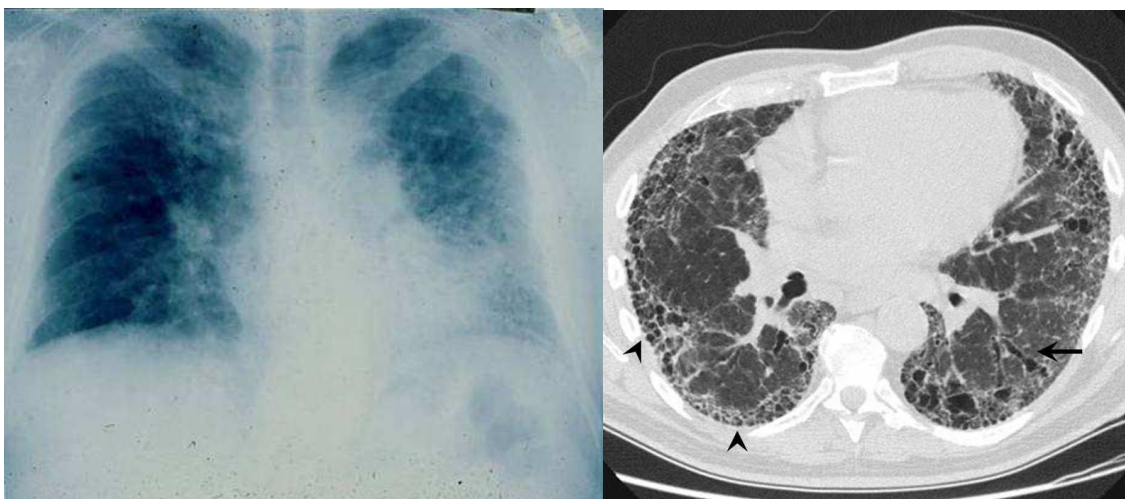
Fig. 1 (esq): Rx de Tórax PA de homem de 67 anos com FPI, com infiltrados bilaterais em padrão reticular.