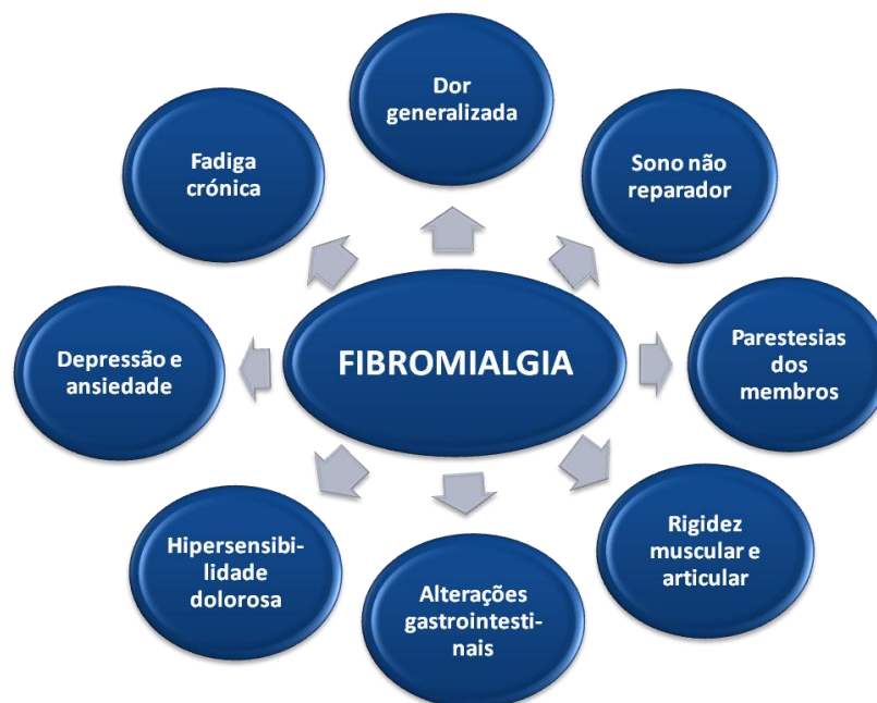
Figura 1 – Principais sintomas que caracterizam a fibromialgia.

Caracterizada por queixas dolorosas neuromusculares difusas e pela presença de pontos dolorosos em regiões anatomicamente determinadas, este quadro sindrômico pode também provocar alterações do humor e diminuição da atividade física, o que piora o quadro de dor do doente. (Leitão 2003, Bennett 2005, Escudero-Carretero et al 2010) Ainda que os seus sintomas sejam variáveis consoante a sua intensidade e possam diminuir temporariamente, agudizar ou mesmo dissipar-se até ressurgirem mais tarde, a gravidade da sintomatologia faz com que a fibromialgia possa tornar-se uma entidade clínica bastante limitativa e debilitante, mesmo quando se trata das simples atividades de vida diária. Por falta de informação, muitos médicos não são ainda capazes de reconhecer esta doença, levando a que muitos doentes não sejam diagnosticados e, embora possam aparentar estar de boa saúde, sofram em silêncio. Assim, revela-se crucial o conhecimento dos principais sintomas dos quais a fibromialgia se faz habitualmente acompanhar, como está esquematizado na Figura 1.