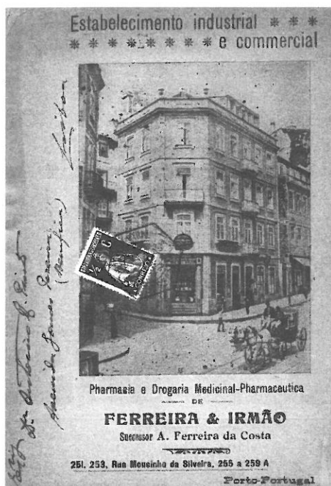
Figure 3 : Pharmacie Ferreira.

La Première Guerre mondiale a eu également un rôle très important pour stimuler les entreprises pharmaceutiques portugaises à produire des médicaments. En 1918, pendant la Première Guerre mondiale, a été fondée la Farmácia Central do Exército (Pharmacie centrale de l'Armée) et qui, en 1948, est devenue le Laboratório Militar de Produtos Químicos e Farmacêuticos (Laboratoire militaire des produits chimiques et pharmaceutiques).