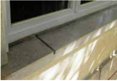
Fig. 9 - Peitoril de janela polido

da chuva entre, um buraco para escoamento da água que porventura se acumule... (Fig. 9) Por onde é que eu lhe vou pegar? Conferia, de novo, as medidas. E, decisão tomada, calçava-a com outras pedras, pegava no escailhador e desbastava o que estava a mais nas dimensões pretendidas. Daí por diante, o peitoril ia ganhando forma, até parecia impossível, mas