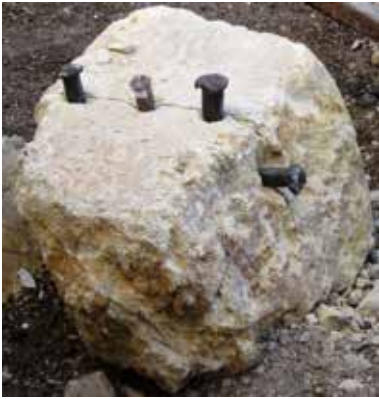
Fig. 5 - Os guilhos

Quando, já pelos anos 60, começaram a proliferar as serrações, não era raro que elas próprias encomendassem blocos inteiros, a cuja serração procediam depois, de acordo também com as encomendas que recebiam. A tarefa de pôr um bloco, de algumas toneladas, em cima da camioneta era, sem dúvida, uma das mais trabalhosas, a exigir perícia e imenso cuidado para segurança de todos. Usava-se o macaco para o pôr a jeito e o carpão que enrolava cabos de aço que o arrastava sobre troncos roliços de árvore.