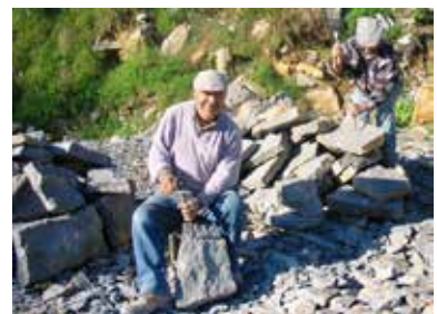
Fig. 8 - A fazer cascões