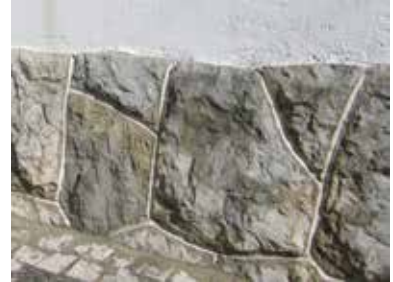
Fig. 6 - Forro a melão

E aí começava outro namoro: por onde é que eu vou começar? Daqui tenho de fazer um peitoril, com ranhura para servir de batente à porta ou à janela e para impedir que a água