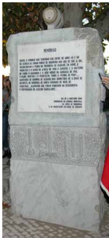
Fig. 3 - Monumento de Birre

Camisas de riscado ou de flanela, calças de cotim ou de ganga (as de bombazina, trazidas de contrabando pelos alcains, reservavam-se para os dias de festa, enquanto novas...), botas cardadas e de bom couro, que amiúde careciam de meias solas ou de uns tombos. Havia quem conseguisse caneleiras, botas de cano alto, mais