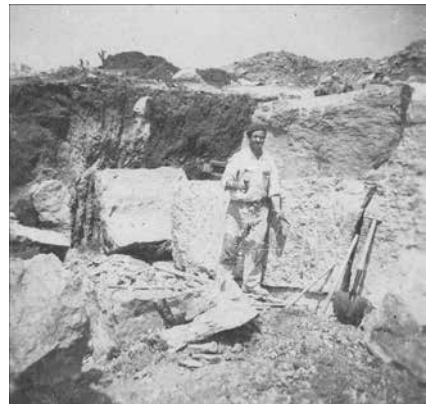
Fig. 4 - A cova e o trabalho do cabouqueiro

Tivera êxito? Ótimo! Nova conversação entre os responsáveis para saber o que fazer de seguida.