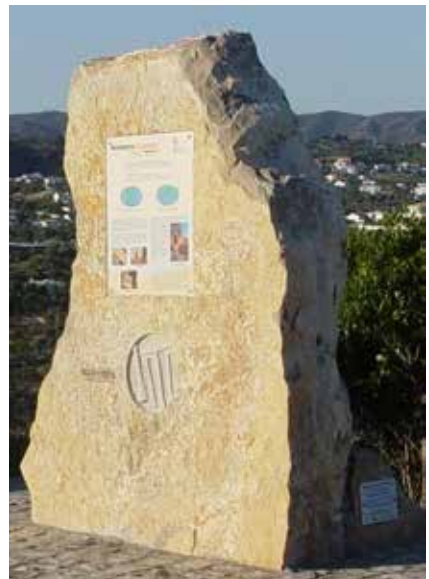
Fig. 2 - Geoponto dos Funchais