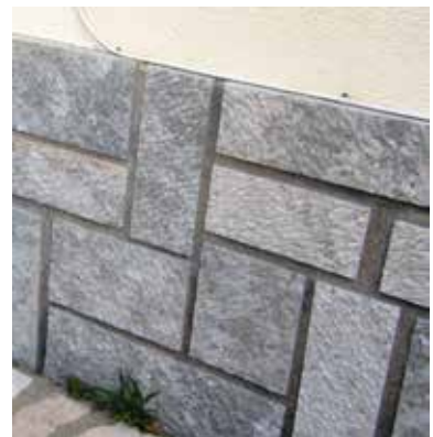
Fig. 7 - Forro a ponteiro