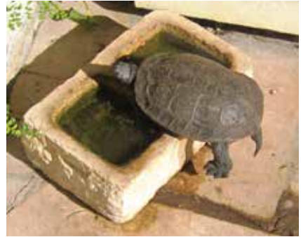
Fig. 1 - Baltazar escarranchado na pia

Para perpetuar a memória desta actividade, ergueu-se o Geoponto dos Funchais (Fig. 2). Sobre ele podem ler-se, por exemplo, estas linhas numa das páginas da Internet: