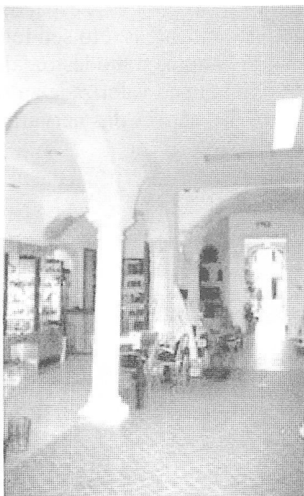
Piso térreo do Hospital (hoje loja de Marthas & C. a S. A.)

jas, para a edificação do hospital, exigindo D. Manuel que tais bens fossem, de pronto, avaliados e entregue o dinheiro, com uma compensação, às referidas igrejas. Também havia casas alugadas, devendo os respectivos alugueres ser satisfeitos. Ao mesmo tempo mandava aparelhar, na casa de baixo, o abrigo para os pobres pedintes, afigurando-se-nos aqui mais liberal que no regimento de Outubro 28 .