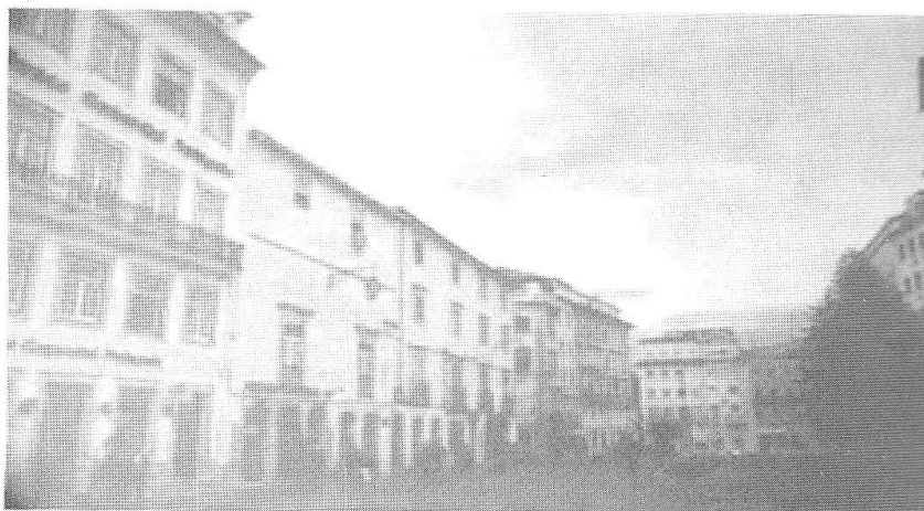
Enquadramento actual do Hospital Novo (hoje Marthas & C. a S. A.).