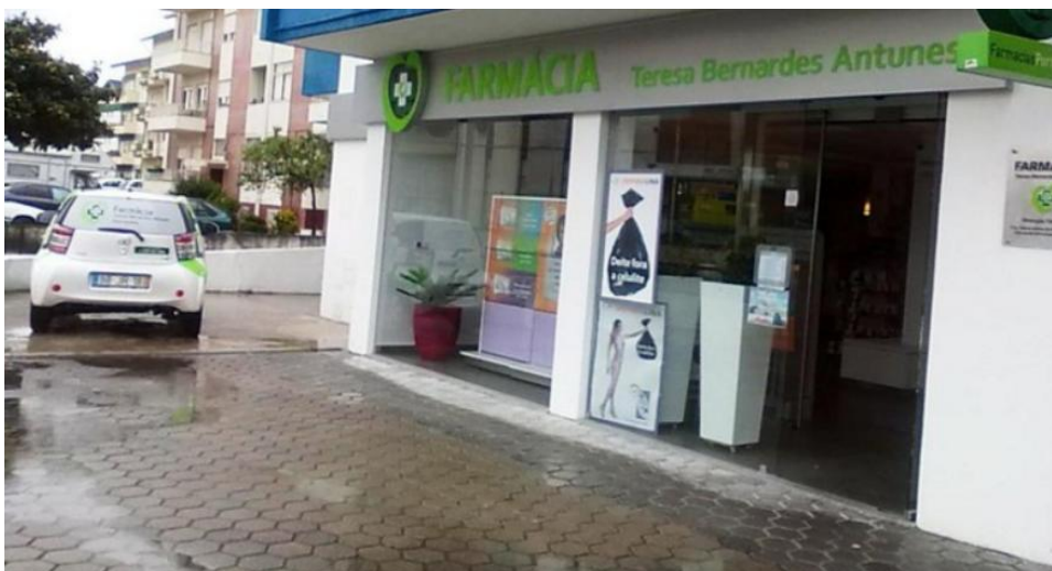
Figura 1 - Espaço exterior da farmácia TBA

A farmácia encontra-se aberta de segunda a sexta-feira das 8h30 às 20h30 e ao sábado das 9h às 19h. Periodicamente cumpre o regime do serviço permanente, ou seja, um serviço de 24h de atendimento ao público.