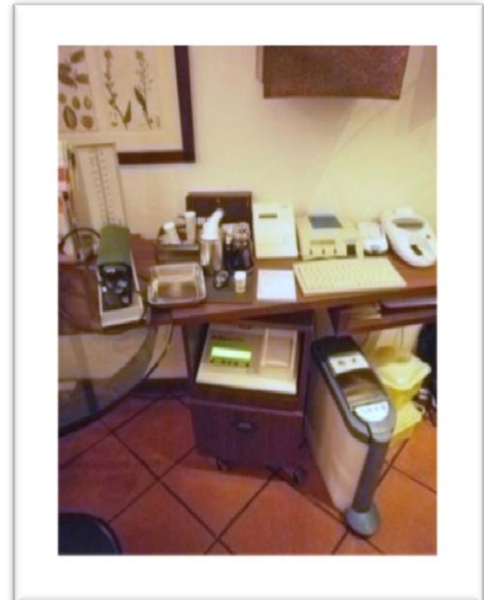
Fig. 2 Zona de Atendimento Personalizado