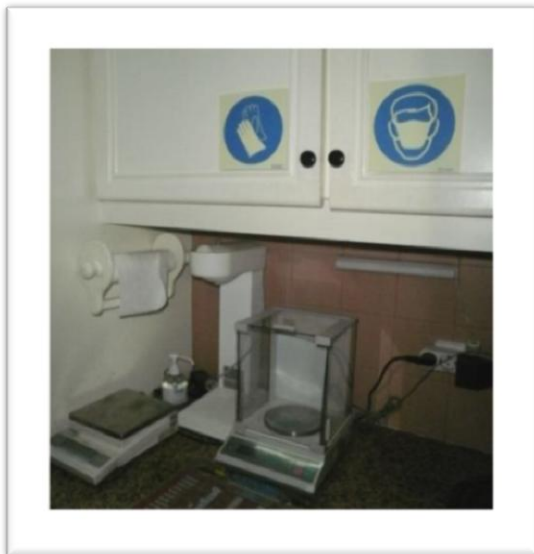
Fig. 3 Laboratório de Manipulados