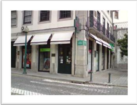
Fig. 1 Espaço exterior da Farmácia Aliança