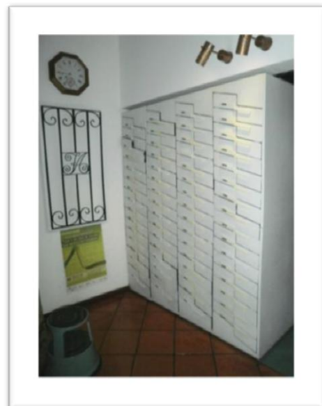
Fig. 4 Gavetas deslizantes