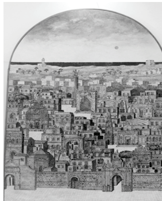
Fig. 4: Veduta di Lecce. 1962