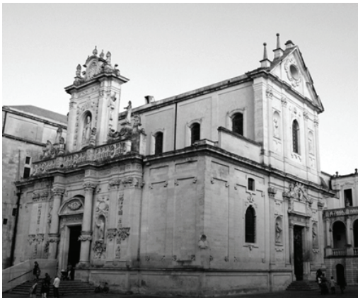
Fig. 11: Cattedrale Santa M. della Assunta s. XVII