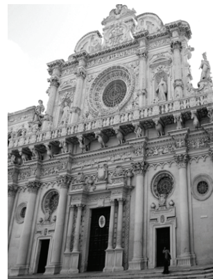
Fig. 8: Basilica di S. Croce s. XVI-XVII