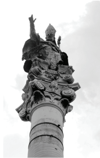
Fig.10: Colonna S. Oronzo s. XVII