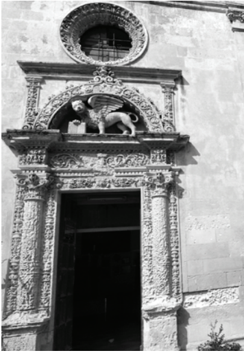
Fig. 9: Chiesa di S. Marco s. XVI-XVII