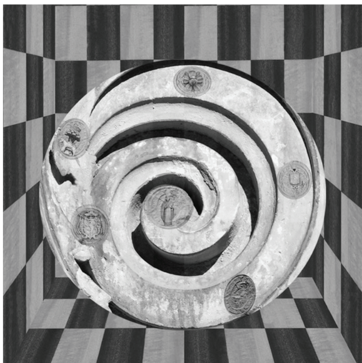
Fig. 2: Fotomontaje. Metamórficos laberintos