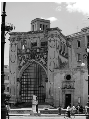
Fig. 7: Il Sedile s. XVI