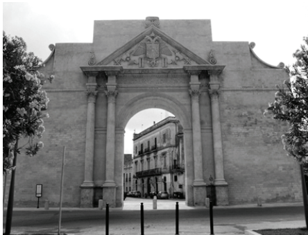
Fig. 5: Porta Napoli Carlo V s. XVI