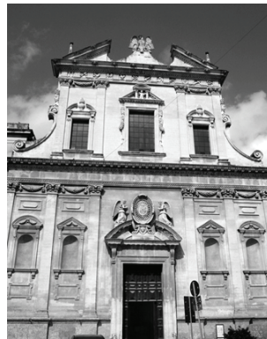
Fig. 6: Chiesa del Gesù s. XVI