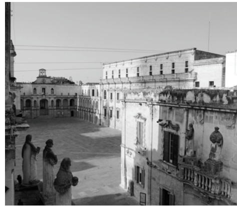
Fig. 12: Piazza Duomo s. XVII-XVIII

Fotografías y fotomontajes: Nieves Sánchez Garre 1999-2009 Pintura Veduta di Lecce: Tonino Caputo 1962