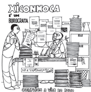
FIGURA 2 — Xiconhoca, o burocrata

No Moçambique recém-independente o risco de fraturas de classe, étnico-regionais ou raciais era enorme. Neste contexto, as declarações sobre a natureza do inimigo contribuíam para delinear com precisão as fronteiras morais do Estado e do povo. A figura do Xiconhoca revela que a relação entre o povo – o coletivo dos ‘novos’ cidadãos – e a Frelimo, que o liderava, assentou no delinear de uma configuração de pertença e exclusão assertiva, procurando ultrapassar os problemas herdados do tempo colonial. Como Alice Dinerman sublinha, na análise da denúncia que esta personagem simbolizava, a Frelimo buscou ampliar o seu apoio popular, denunciando características identitárias negativas específicas, como o racismo, o tribalismo ou o regionalismo, ou ainda contra ideologias mistificadoras que desafiavam a proposta da Frelimo, como o liberalismo, o populismo, ou o esquerdismo (2006: 70). Na primeira década da independência, era praticamente impossível falar de diferenças sociais para além das diferenças óbvias entre colonizadores e povos oprimidos, entre ricos e pobres, etc. Referências a outras formas de diferença – fossem de natureza cultural ou mesmo étnica – eram condenadas como promotoras de regionalismo e de ações tribalistas, como ameaças à integridade da nação.