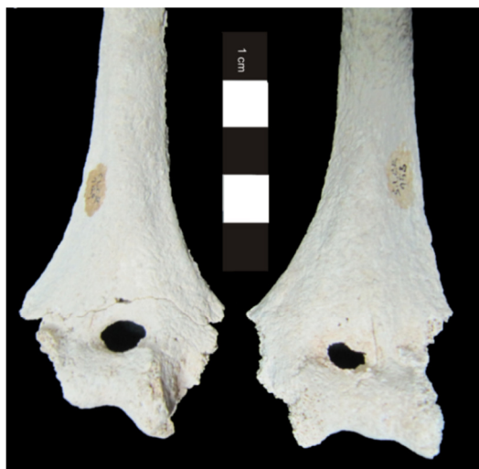
Figura 3.17. Presença bilateral de abertura septal dos úmeros do indivíduo 158 (adulto feminino).