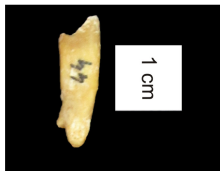
Figura 3.20. Primeiro pré-molar inferior direito, do indivíduo 164 (adulto masculino), com raiz bifurcada.