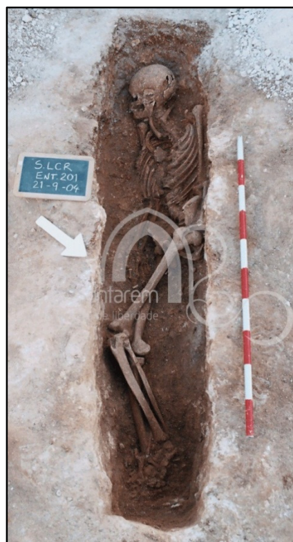
Figura 3.2. Enterramento 201 (indivíduo adulto masculino) sendo evidente o decúbito lateral direito.