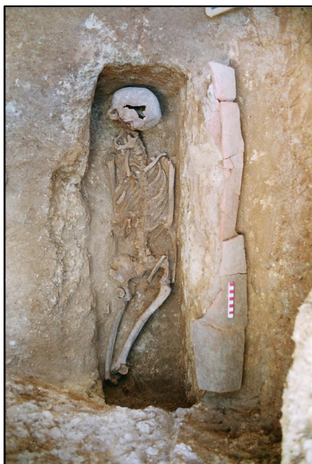
Figura 3.3. Enterramento com uma cobertura de sepultura composta por telhas (sector 10) (Matias (2007:20).