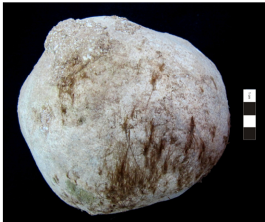
Figura 3.5. Presença de musgo no crânio do indivíduo 173 (adulto masculino).