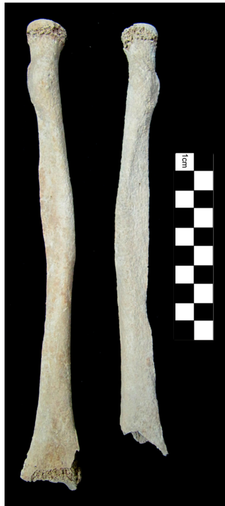
Figura 3.9. Rádios do indivíduo 179 (adulto masculino) destacando-se a maior afetação da superfície óssea no rádio direito.