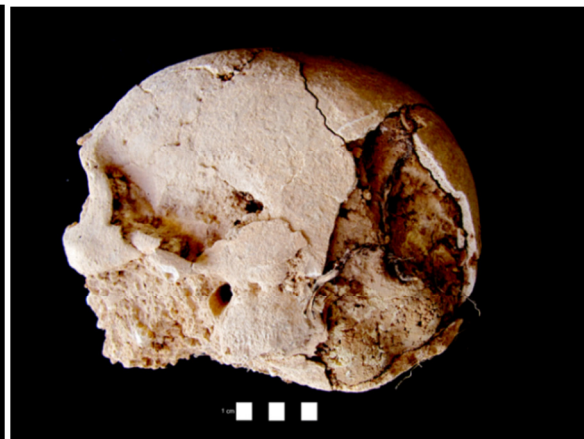
Figura 3.6. Presença de raízes no crânio do indivíduo 135 (adulto masculino).