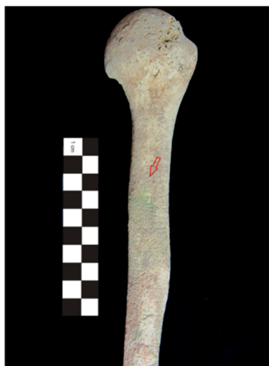
Figura 3.8. Presença de uma coloração esverdeada na diáfise do úmero esquerdo do indivíduo 369 (adulto masculino).