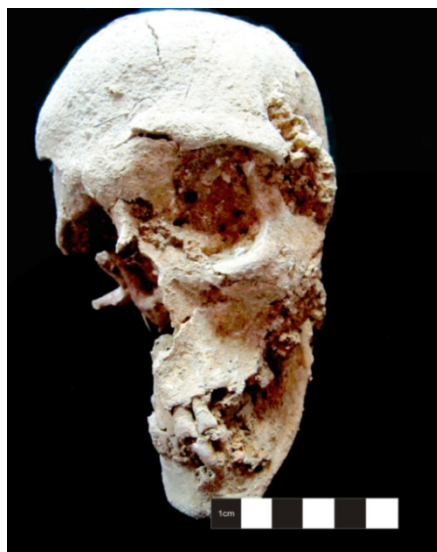
Figura 3.4. Achatamento do crânio do indivíduo 136 (adulto feminino).