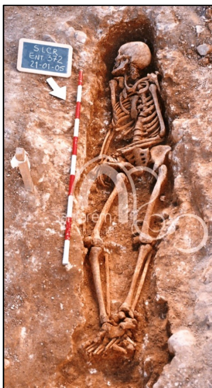
Figura 3.1. No enterramento 372 (indivíduo adulto feminino) observa-se a movimentação do corpo post mortem assim como as diferenças de sedimento (Foto da Câmara Municipal de Santarém).