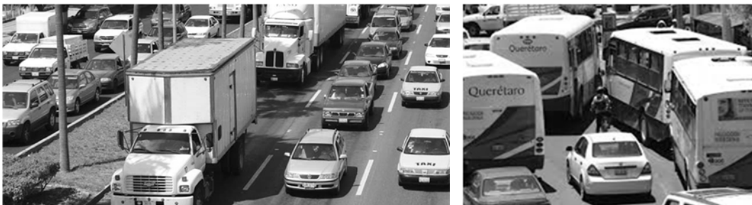
Figura 5. Problemas de movilidad dentro de la ciudad de Santiago de Querétaro.

En cuanto al transporte público se refiere, es necesario generar una reestructuración, ya que este sistema ha crecido fuera de control, brindando un servicio inadecuado e inseguro, por lo cual, los residentes prefieren optar por la adquisición de un vehículo propio a su utilización.