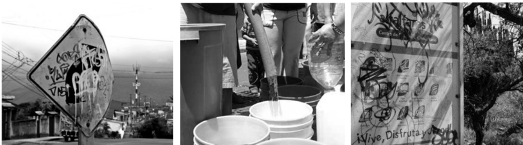
Figura 7. Descuido de infraestructura, mobiliario y equipamiento urbano.

La parte de infraestructura va intrínsecamente relacionada con la cuestión socio-económica y el estatus social, encontrando que existen partes de la ciudad donde el planeamiento urbano es un tema de suma importancia, pero en otras zonas se puede observar el descuido inminente de infraestructura, mobiliario y equipamiento urbano (Fig. 7). Se recomienda impulsar la mejora de la infraestructura y el equipamiento urbano, promoviendo una igualdad en los servicios ofrecidos (agua potable, drenaje, electricidad, recolección y tratamiento de residuos), incrementar los espacios verdes y recreativos, proteger el patrimonio cultural e histórico, así como mejorar el comercio, el turismo y el sector industria.