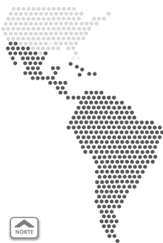
Figura 1. Región de América Latina y el Caribe.