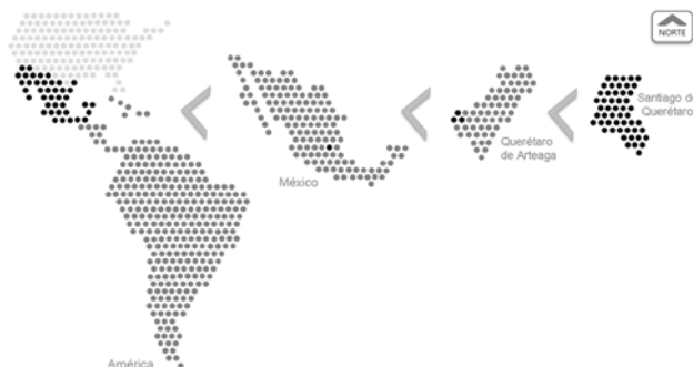
Figura 2. Localización de la ciudad de Santiago de Querétaro.

Santiago de Querétaro es la capital del estado de Querétaro de Arteaga, localizado en la región del Bajío del territorio Mexicano (Fig. 2).