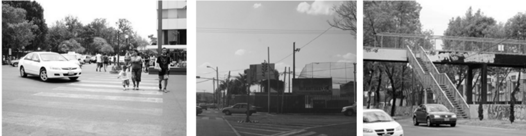
Figura 6. Problemas de accesibilidad peatonal.

o en ciertos casos improvisados, debido a que se eliminan las bahías, falta de una iluminación y señalización adecuada, creando espacios inseguros para las personas que utilizan el transporte público. A su vez en el aspecto peatonal, el vehículo privado tanto público resultan ser una amenaza para los peatones, no respetando las zonas destinadas para ellos como las banquetas, pasos de cebra, así como la infraestructura para el peatón (puentes peatonales, semáforos, etc.) no es la adecuada para propiciar una movilidad segura (Fig. 6).