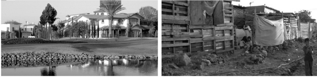
Figura 4. Desigualdad social dentro de la ciudad de Santiago de Querétaro.

De acuerdo con este estudio, la población de Querétaro es principalmente de clase baja, pero la distinción de clases sociales, el desequilibrio y la inequidad social, son sin duda de las principales problemáticas dentro de la ciudad y de toda la región de Latinoamérica. A si mismo, el problema de desigualdad puede detonar otros conflictos de desarrollo social, como: la desertificación de distintas zonas residenciales, el fraccionamiento de la configuración urbana, la marginación, la inseguridad, la degradación de viviendas, la falta de coherencia entre arquitectura habitable y confort social y el detrimento en el ámbito de salud.