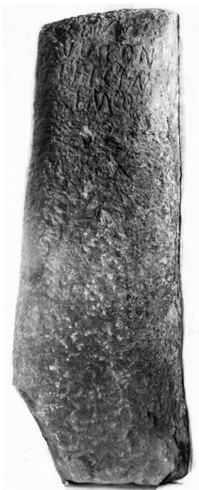
Figura. 3. IRCP 660 .

Que conclusão daqui se tiraria? Que também neste extremo meridional lusitano houve intervenção do imperador Augusto —aspecto que, salvo o erro, não tem sido problematizado, quiçá também por apenas termos este documento truncado. Quando o estudei, escrevi: