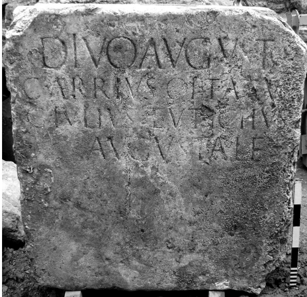
Figura. 2. Divo Augusto .

Tibério a política de, através da divinização, fomentar o culto imperial; prova o primeiro, mediante especialmente o uso da palavra sacrum , que a devotio referida por Robert Étienne teve manifestações concretas ainda mesmo durante o reinado de Augusto.