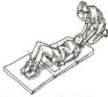
Posição Inicial para o Teste de Abdominais