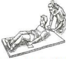
Posição do aluno na fase ascendente durante o Teste de Abdominais