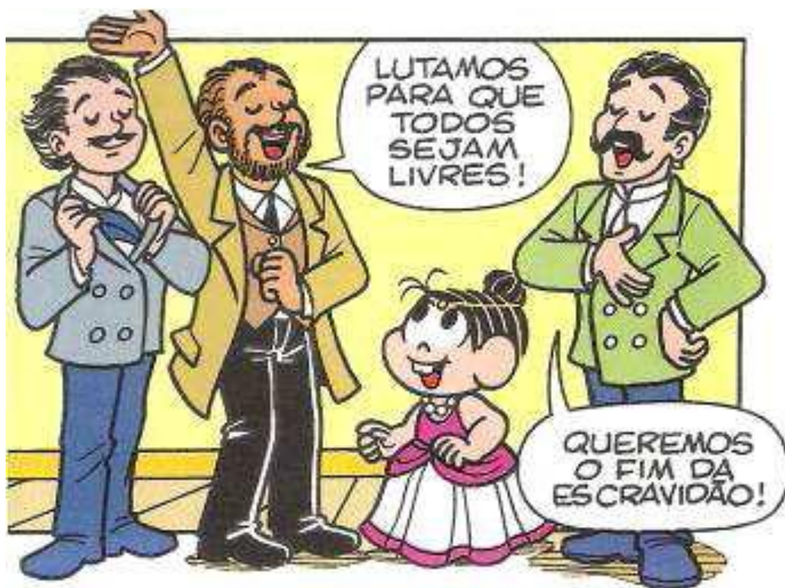
Figura 4 – Castro Alves, José do Patrocínio e Rui Barbosa

Fonte: (Sousa, 2004:30). “Abolição dos Escravos” Fascículo 1