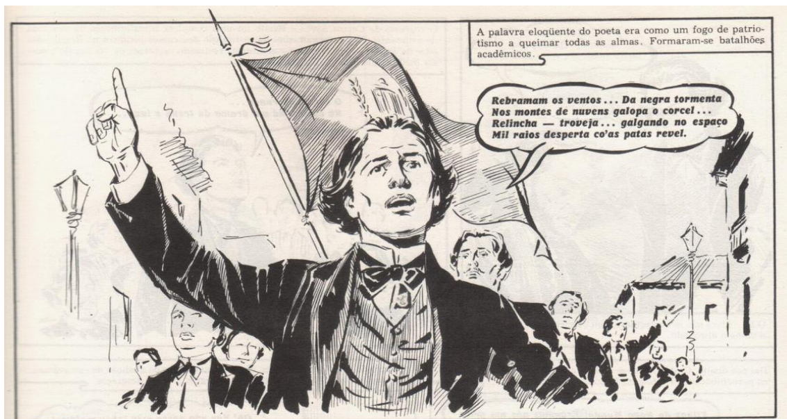
FIGURA 1 – Castro Alves e o poema “Pedro Ivo”

O perfil social do “poeta dos escravos” perpassa toda a narrativa e é acentuadamente alicerçado em alguns de seus poemas devotados às grandes causas liberal-democráticas da segunda metade do século XIX. No quadro abaixo o poeta assume uma posição de destaque e declama o poema “Pedro Ivo” (Alves, 1997:113), feito em louvor do herói republicano de Pernambuco. O Narrador reforça a imagem, dizendo que “a palavra do poeta era como um fogo de patriotismo” e mostra o poder arrebatador dessa palavra que leva os outros a acompanhá-lo: “formaram-se batalhões acadêmicos” (Miranda, 1974:8).