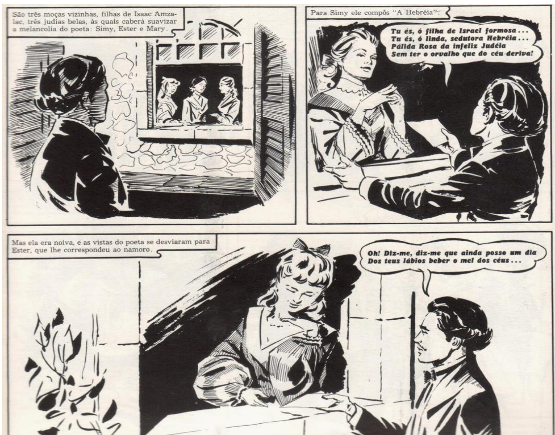
Figura 3 – o perene amante

“Pensamento de Amor” (Alves, 1997:415). Note-se que as cenas acabam por sublinhar a inconstância do poeta e os balões põem, na sua própria boca, como palavras suas e não como poemas, os versos que compôs em louvor das irmãs judias.