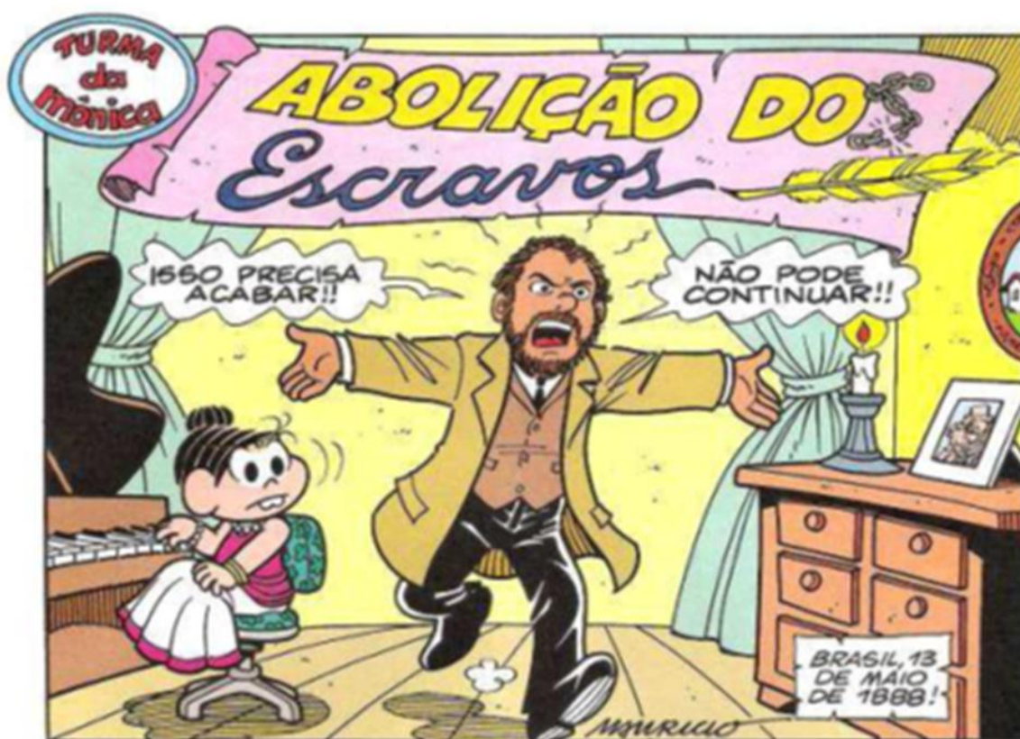
Figura 5 – José do Patrocínio e o início in medias res

Fonte: (SOUSA, 2004:3). “Abolição dos Escravos” Fascículo 1