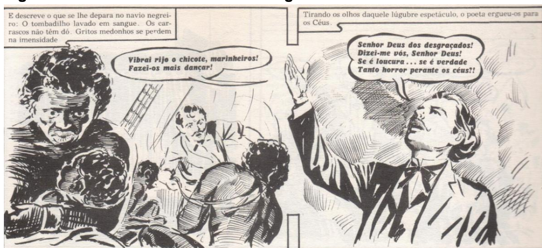
Figura 2 – Castro Alves e “O Navio Negreiro”

Entretanto, o ponto culminante do perfil social do poeta se dá na representação do poema abolicionista “O Navio Negreiro”: os quadrinhos exploram uma dualidade temporal e espacial — ao mesmo tempo que mostram o poeta clamando em prol dos negros escravizados (Bahia, séc. XIX), focam as cenas descritas pelo poema (Oceano Atlântico, séc. XVII a XVIII).