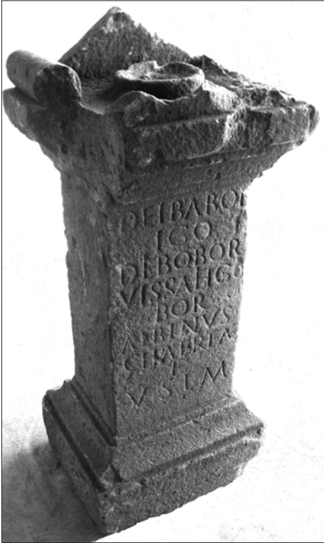
Fig. 2. Autel votif de Viseu (Photo Arqueohoje).