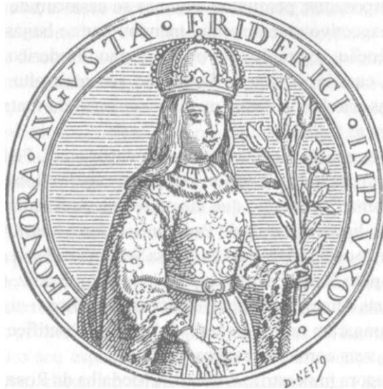
Medalha da rosa

Santa, destino de tantos peregrinos, nela havendo recebido as máximas honras da bênção papal do seu matrimónio e de ser ungida e coroada imperatriz, na Igreja de S. Pedro, pelo Sumo Pontífice. Recebera ela, afinal, o que nenhum rei da dinastia de Avis lograra, a sagração e coroação real, que, mesmo a ter existido, nunca poderia vir pela mão do Papa 71 . Mas Leonora tê-la-ia assumido como mais uma glória para a sua linhagem e para o seu reino.