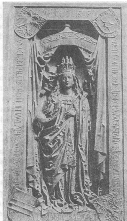
Túmulo jacente de D. Leonor

Leonor, como que antecipando a saga da sua linhagem e do seu reino, sonhou o Império... mas " o Império se (lhe) desfez". Todavia, nas asas do sonho, materializou-se o fundamento da reprodutiva linhagem dos Habsburgo, raiz matricial do grande imperador Carlos V, que também no reino de Portugal buscou esposa. Desta vez Isabel, a filha do Venturoso rei das Índias e da Terra de Vera Cruz, D. Manuel I.