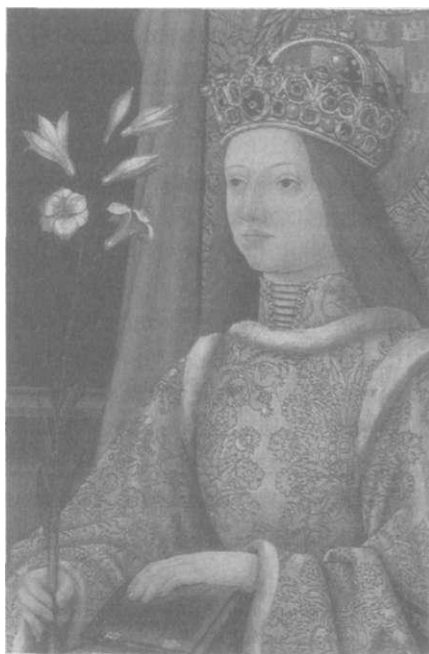
Retrato de D. Leonor

A 19 de Fevereiro sai D. Leonor, com a sua comitiva, em direcção a Siena, sendo recebida primeiro pelo duque Alberto, irmão do imperador, e por Ladislau, rei da Hungria, e em seguida pelos cidadãos, para só depois de transpostas as portas da cidade, numa outra simbólica passagem, vir a conhecer o seu esposo. O retrato desse encontro pintou-o Pintorrichio, como mostrámos, ao abrir. Agora são as palavras que nos descobrem os gestos - apeiam-se os noivos ao avistarem-se, ouvem-se discursos, o bispo de Siena dá-lhes a cruz a beijar. Mas onde se desvendam as emoções? Lanckmann diz que o Imperador abraçou Leonor e o pintor deixa na imagem o enlace das mãos, que Lopo de Almeida só descreve à porta da Sé, enquanto Rui de Pina diz que a imperatriz quis beijar a mão do seu esposo, o que ele não consentiu. Mas que sentimentos atravessariam D. Leonor ao conhecer o seu esposo? E Frederico terá, na verdade, vacilado perante a pequenez da sua esposa, para logo depois se deixar atrair pela sua beleza meridional e temperada conversação? 60 Nunca o saberemos.