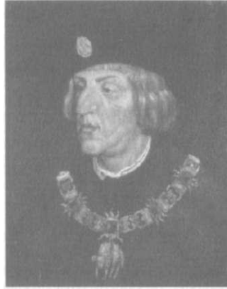
Maximiliano I, imperador da Alemanha

contemplada com cinco filhos, viu porém desaparecer a sua maioria, para se quedar apenas com dois, Maximiliano e Cunegundes 81 .