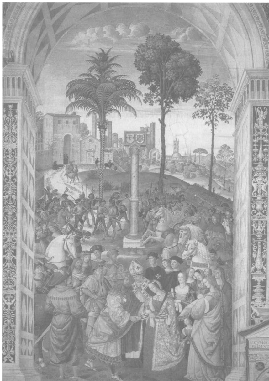
Primeiro encontro de Frederico III e D. Leonor, em Siena

Contemplemos agora as formas e personagens de um fresco da catedral de Siena. O pintor é Pintorricchio: