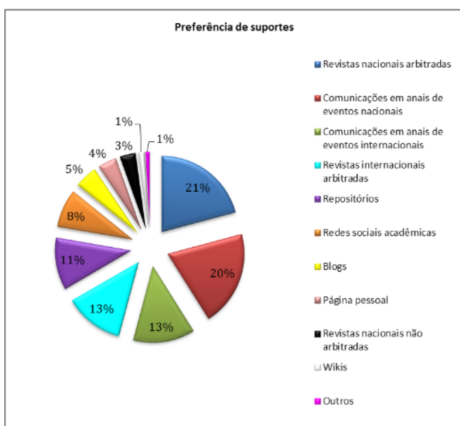
Gráfico 3 – Suportes preferenciais para comunicação da ciência

Na categoria “outros”, foram apontados: redes sociais abertas, páginas dos grupos de pesquisa, revistas internacionais (categoria que já havia sido contemplada) e e-book (Gráfico 3).