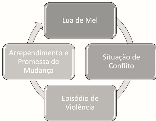
Figura 1 - O círculo vicioso da violência doméstica contra a mulher

podendo enquadrar-se num modelo rígido, o CFP adapta o ciclo da violência proposto por Walker, em 1979, e acrescenta ainda uma quarta etapa – “Arrependimento e promessa de mudança” – conforme se demonstra a seguir (Figura 1).