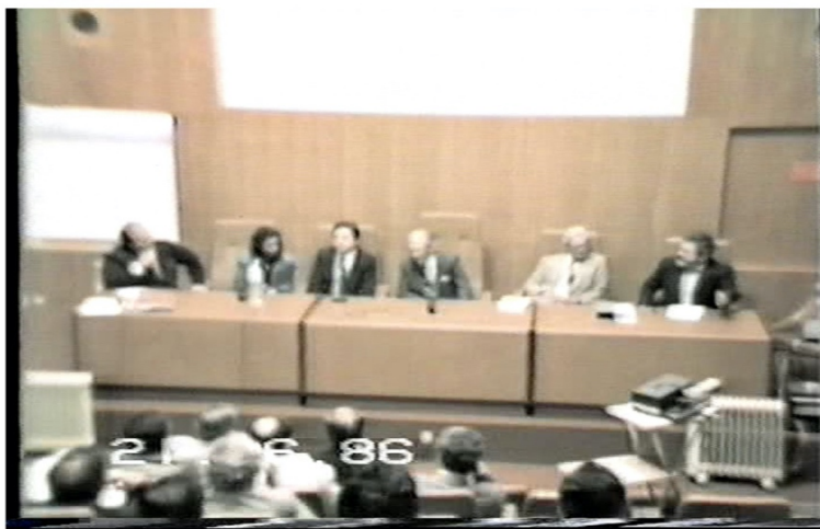
Figura 40: Curso de Ciências do Sistema Nervoso, Hospital Júlio de Matos, 1986. Sessão consagrada à Psicocirurgia.

Quanto ao segundo tópico – o do prestígio de uns em detrimento de outros –, os relatos e avaliações inseridos nas biografias remetem para o carácter coletivo do trabalho científico, como aliás de todo o trabalho intelectual. Egas Moniz capitalizou prestígio científico, mas os projetos de investigação só progrediram na medida em que os maiores obstáculos experimentais foram superados graças à criatividade e engenho de muitos cujas identidades ficaram na sombra.