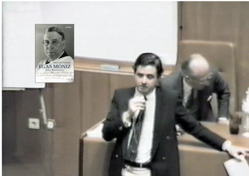
Figura 39: João Lobo Antunes (1944-2016). Montagem com o seu livro Egas Moniz: uma biografia , de 2010.