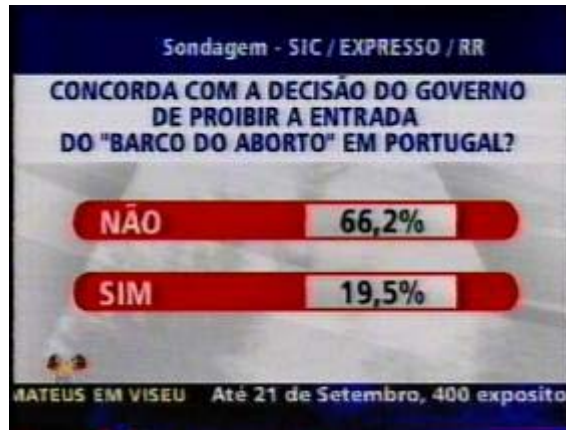
Figura 9: Sondagem SIC/EXPRESSO/Rádio Renascença in www.womenonwaves.org