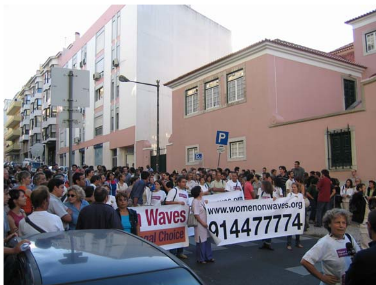
Figura 8: Manifestação realizada em Lisboa, a 1 de Setembro de 2004. Fotografia Pessoal.

A seis de Setembro é conhecida a decisão do Tribunal Administrativo e Fiscal de Coimbra. Baseados no direito de livre circulação, direito de expressão e de divulgação de pensamento, direito de reunião, direito de manifestação, direito de se informar e de ser informado, os tripulantes do navio Borndiep , de pavilhão holandês, a WOW e as quatro associações portuguesas envolvidas propuseram, contra o Ministério da Defesa Nacional e dos Assuntos do Mar e o Instituto Portuário e dos Transportes Marítimos, um processo urgente de intimação para a protecção de direitos, liberdades e garantias que entendiam