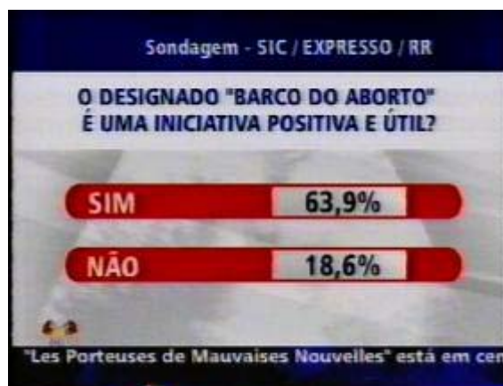
Figura 12: Sondagem SIC/EXPRESSO/Rádio Renascença in www.womenonwaves.org

Sondagens realizadas aquando a campanha e após o seu termo, demonstraram que os/as portugueses/as tendiam a concordar com a mudança da lei, evidenciando um apoio significativo para com a campanha.