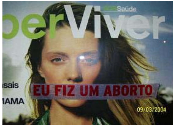
Figura 5: Inscrições “Eu fiz um aborto” colocada num cartaz publicitário em Lisboa

tinha acabado de fazer a viagem que muitas mulheres portuguesas fazem todos os anos para poder abortar, já a divulgação pública do uso do Misoprostol para efeitos abortivos parece ter sido contraproducente para o projecto, com alguns apoiantes a criticarem a activista.