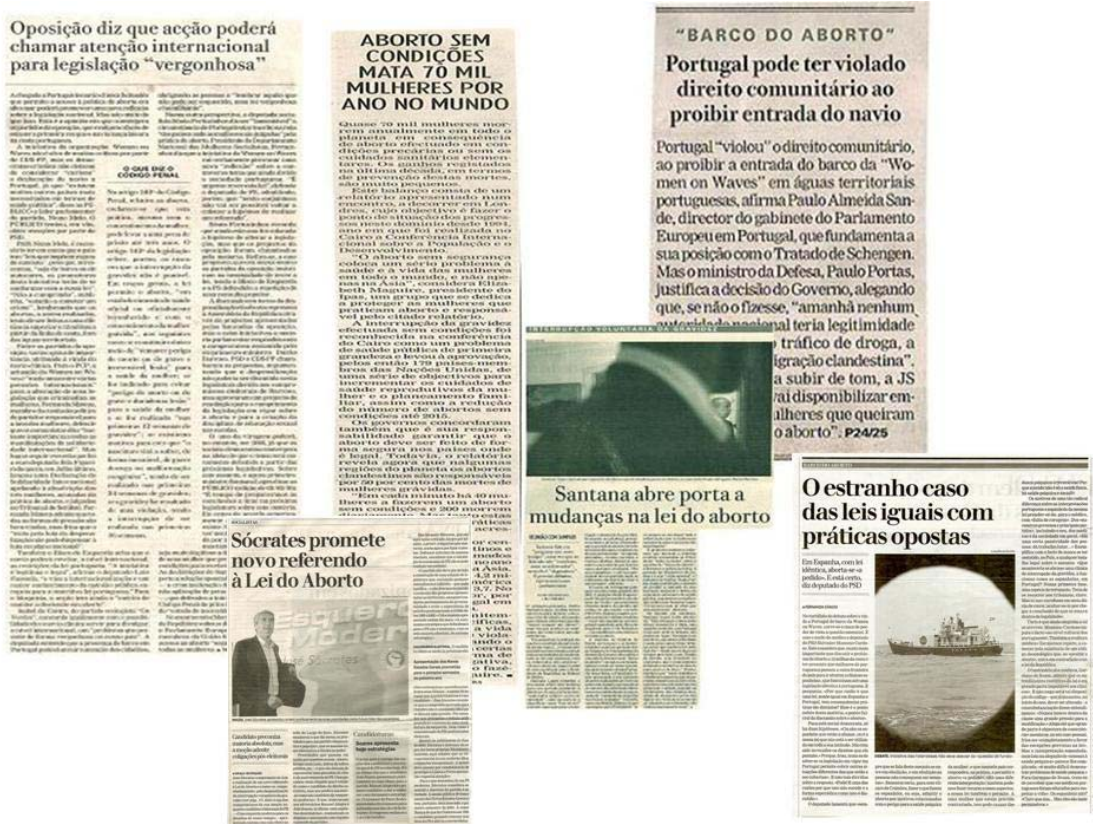
Figura 11: Recortes de jornais sobre a possibilidade da mudança da lei

contrariamente à grande maioria dos países europeus, uma lei restritiva; e, por fim, sensibilizar a população para a necessidade da mudança da lei.