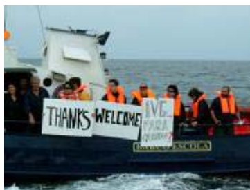
Figura 4: Embarcação alugada para deslocar as pessoas ao Borndiep in