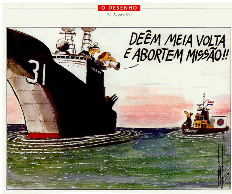
Figura 3: Cartoon de Augusto Cid, Focus , 01/09/2004

Na sequência da interdição da entrada do Borndiep foi notório, no seio dos activistas, um certo desnorte. A cautelosa formação que mais de trinta voluntários tinham recebido preparava-os para qualquer imprevisto e obstáculos após a chegada do Barco a águas territoriais, inclusive a perseguição judicial, mas não para a eventualidade da sua não chegada. Tornou-se incontornável repensar todos os aspectos estratégicos da campanha. As arenas de acção privilegiadas eram, agora, três: a legal, através da equipa jurídica; a pública, com o recurso aos media ; e a política, mediante o lobby exercido junto dos partidos políticos portugueses e do Governo holandês. Tal actuação tripartida visava por um lado, levar a que o Governo português levantasse a interdição e, por outro, manter a campanha atractiva para os meios de comunicação.