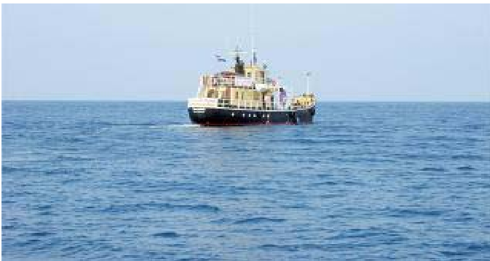
Figura 1: Borndiep

Neste texto pretendo, à luz da discussão do potencial emancipatório do direito nas lutas dos movimentos sociais, fazer uma breve reflexão sobre o desenrolar desta campanha específica, enfatizando o papel do direito na sustentação da mesma.