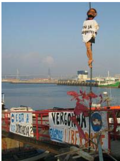
Figura 7: Faixas de apoio à campanha colocadas no Porto da Figueira da Foz