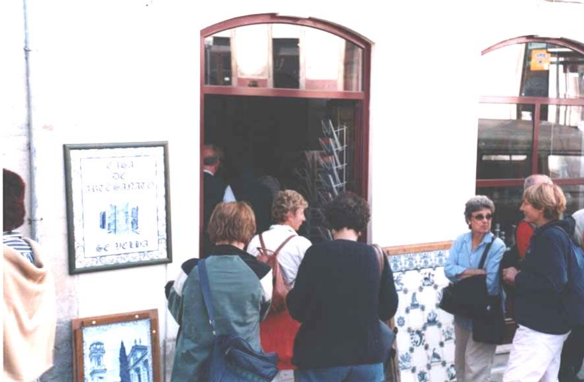
Imagem 5 Aglomeração de turistas numa das casas de artesanato do Largo da Sé Velha

criar uma mais-valia simbólica, uma vez que o artesanato não representa apenas tradições antigas, mas também o exótico encantatório. 25 Os objectos artesanais, fazendo parte da vasta panóplia das “lembranças”, oscilam entre uma ambiguidade que resulta do seu carácter híbrido de “produtos abastardados da era pós-industrial” e entre aspectos locais, identitariamente instrumentalizados por actores envolvidos na criação de um “espírito de lugar” para criar diferenças face a uma globalização vista como factor nivelante (Hitchcock, 2000; Appadurai, 1996: cap. VIII).