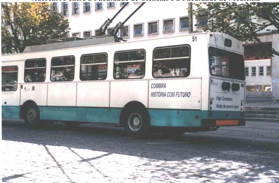
Imagem 3 Autocarro entre a Faculdade de Ciências e a Faculdade de Medicina

retórica urbana. Esta amálgama de espaços e de tempos faz do passado consagrado e estetizado um instrumento de inovação e de modernização, ao mesmo tempo que, através do recurso a uma cosmética de imagens, converte o presente em passado distante e o futuro anunciado num presente que está por chegar.