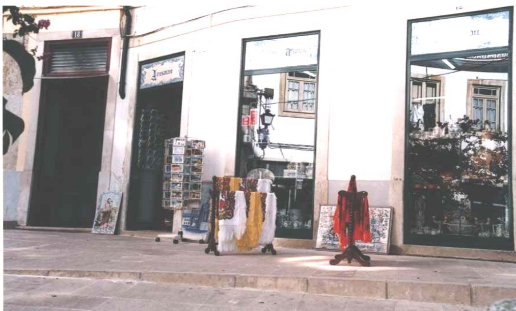
Imagem 4 Casa de venda de artesanato no eixo pedonal Arco da Almedina-Sé Velha

É aí que os turistas que demandam Coimbra podem finalmente encontrar os objectos “tradicionais e únicos” que permitem “testemunhar” a sua passagem pela cidade. Muitas destas lembranças são feitas para parecerem antigas. A cerâmica, particularmente os painéis de azulejos, imita a azulejaria barroca portuguesa que está representada em muitos monumentos da cidade. Mas, no contexto da experiência turística, a simplificação torna-se fundamental. A percepção dos turistas relativamente aos habitantes locais tende a ser estereotipada e as lembranças acabam por ser visões condensadas e simplificadas das suas vidas (Hitchcock, 2000). É por isso que os motivos dos azulejos são frequentemente signos facilmente identificáveis: a Torre da Universidade, o estudante de capa e batina ou a caravela. 24 Por outro lado, os ornamentos e o colorido abundante da cerâmica, comercializada sob a forma de produtos diversos, constituem elementos fundamentais para