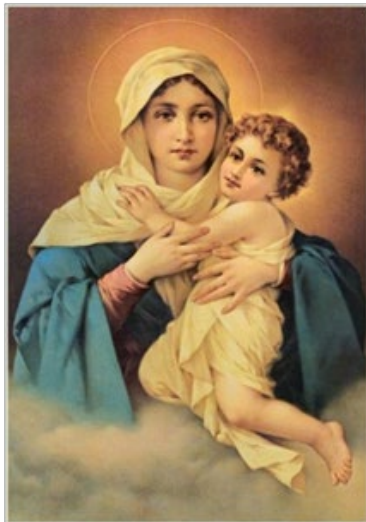
Figura 9. Imagens de “santinhos” da igreja católica, com orações no verso, ainda hoje de grande distribuição entre os fiéis

O avanço dos grupos religiosos neopentecostais,