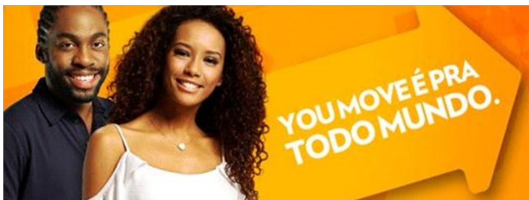
Figura 3. Publicidade de divulgação do curso YouMove