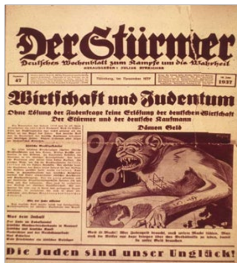
Figura 8. Jornal Der Stürmer acusando os judeus de crime econômico, usando a figura do “Demônio do Dinheiro”. Um monstro judeu, gravado com a estrela de David e os símbolos para o dólar americano e a libra britânica tem suas garras no planeta, em novembro de 1937.