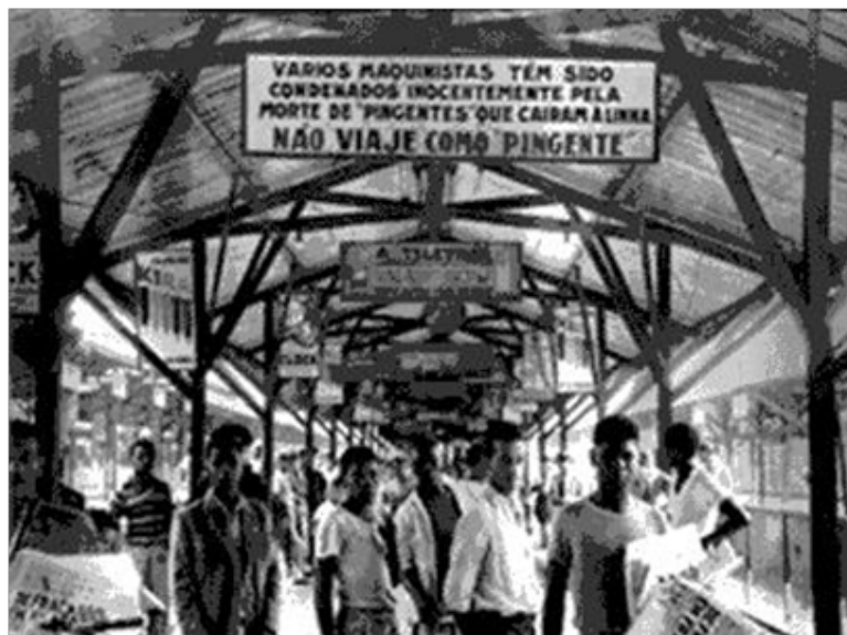
Figura 4. Plataforma de trens da estação Pedro II, com um informe responsabilizando o “pingente” (passageiro que viajava pendurado nas portas dos vagões devido à superlotação) por sua própria morte, na década de 50. (Macedo, 2004)

Acerca da desumanização, Haslam (2006) destaca que, para ser considerado humano, deve possuir características unicamente humanas como socialização, moralidade, cultura e aprendizagem, ou características de natureza humana que têm relação com disposições biológicas e com elementos inatos e compartilhados