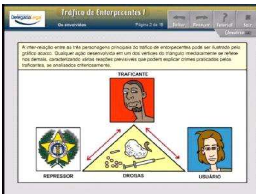
Figura 2. Tela do curso on line