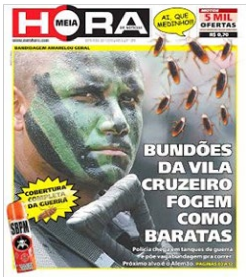
Figura 5. Primeira página do Jornal Meia Hora em 26/11/2010, acerca das operações policiais em favelas do Rio de Janeiro

Nestas imagens, vemos apenas dois exemplos de desumanização promovida pela mídia, que ilustram nosso pensamento. As mortes em ações policiais são banalizadas e até aplaudidas. A comparação com insetos facilita o consentimento destas e de tantas outras mortes; ela as justifica como inevitáveis para o bem de todos; à semelhança dos discursos já mencionados, construídos no nazismo, sobre os judeus.