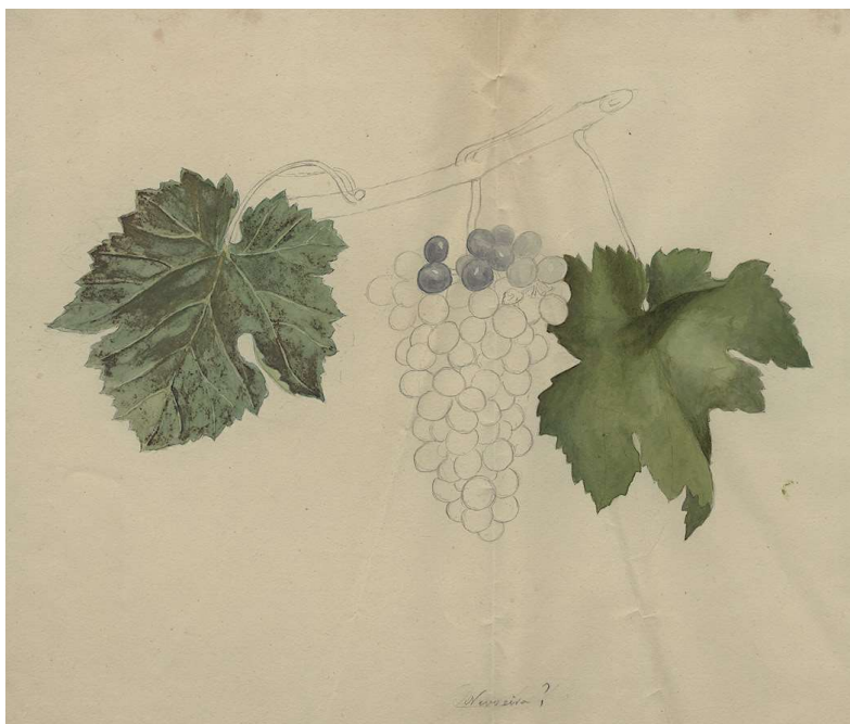
Fig. 1. Desenho de uva nevoeira(?), possivelmente de Emílio de Oliveira Pimentel, filho de Júlio Máximo de Oliveira Pimentel, 2.º Visconde de Vila Maior

Assim, o Visconde de Vila Maior defendia a formação de grandes coleções ampe- lográficas, nas quais se reunissem as castas de maior interesse, para facilitar o estudo de comparação e classificação. Na verdade, a proposta de Júlio Máximo de Oliveira Pimentel era a da criação de coleções regionais organizadas em escolas de viticultura prática, onde estivessem representadas as castas próprias de cada região.