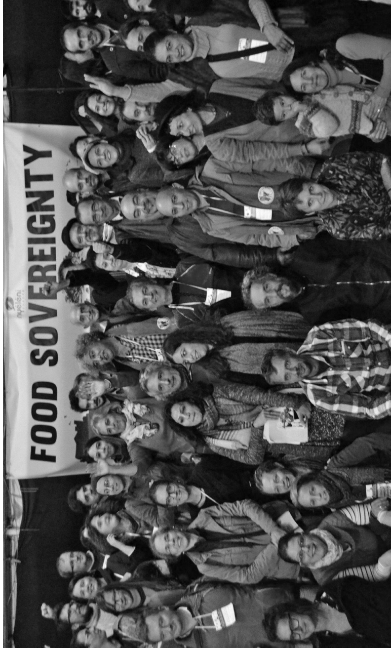
Forumului Nyéléni Europa pentru Suveranitate Alimentară, octombrie 2016, Cluj-Napoca, fotografie din arhiva Eco Ruralis