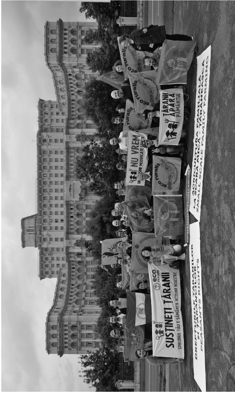
Demonstrație Eco Ruralis și Confederația Europeană Țărănească Via Campesina în fața Parlamentului României pe tema prioritizării drepturilor omului și a drepturilor țăranilor în noua Politică Agricolă Comună (PAC), București, iunie 2019