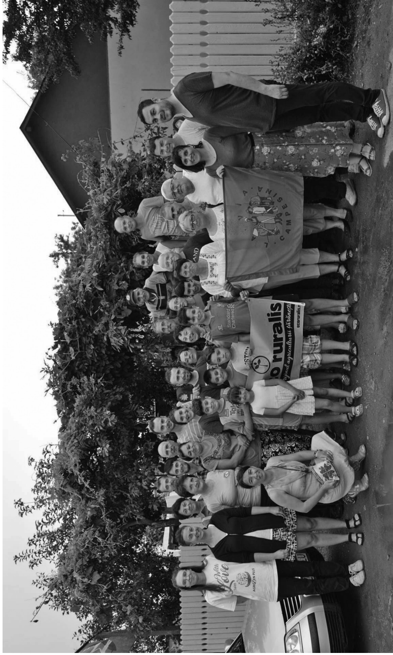
Întâlnirea grupului de lucru Eco Ruralis pentru dreptul la semințe, Dâmbroca, Buzău, iulie 2018