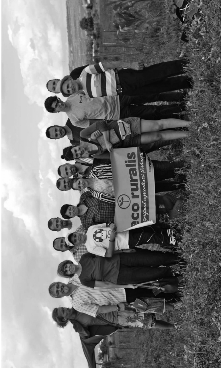
Întâlnirea grupului de lucru Eco Ruralis pentru dreptul la semințe, Sopor, Cluj, iulie 2017