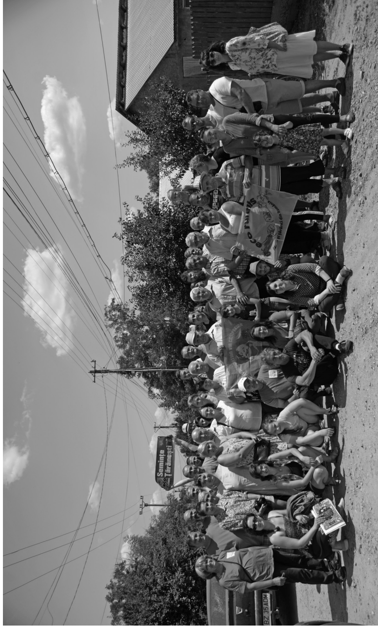
Întâlnirea grupului de lucru Eco Ruralis pentru dreptul la semințe, Dâmbroca, Buzău, iulie 2021