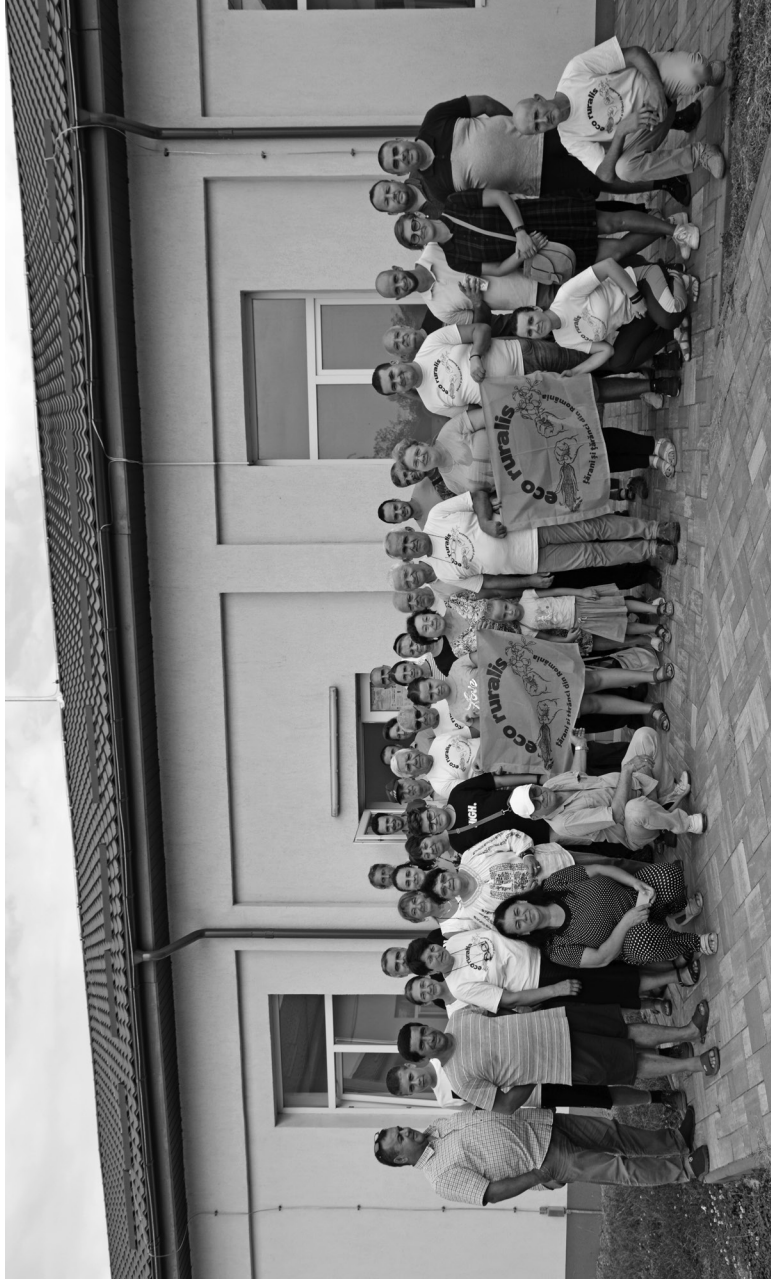
Întâlnirea grupului de lucru Eco Ruralis pentru dreptul la semințe, Dâmbroca, Buzău, august 2022