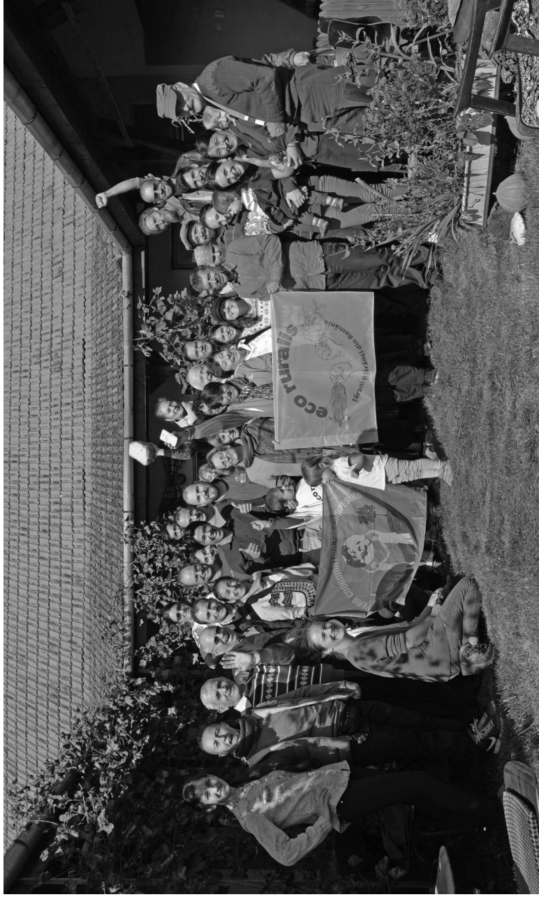
Adunarea generală a asociației Eco Ruralis, Țopa, Mureș, octombrie 2017