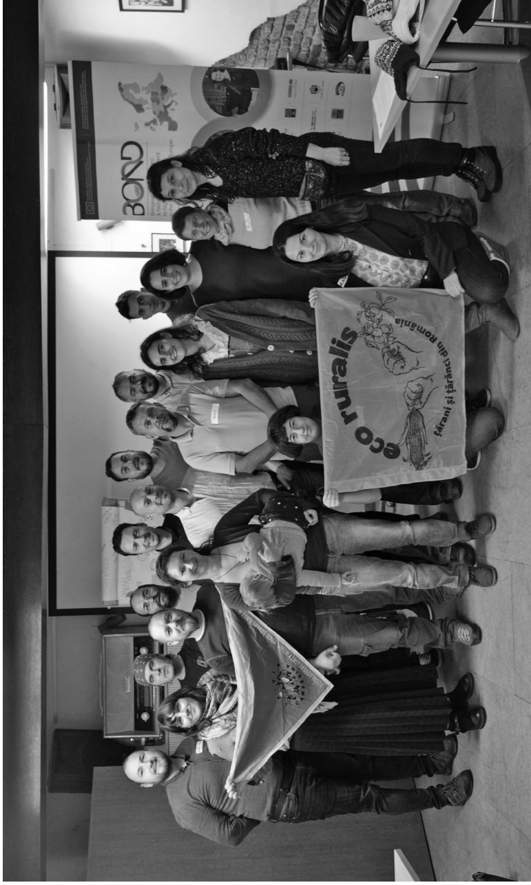
Primul training de formare politică, noiembrie 2019, Cluj-Napoca