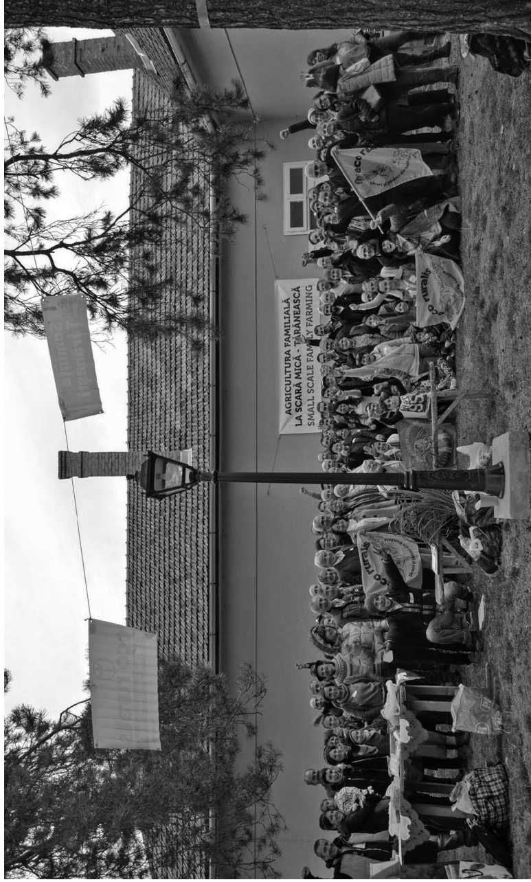
Adunarea generală a asociației Eco Ruralis, Sâncraiu, Cluj, octombrie 2019