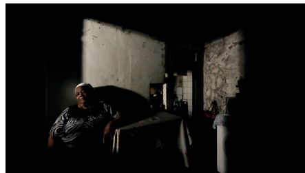
Figura 5 - Mulher sentada, Cavalo Dinheiro (2014), de Pedro Costa