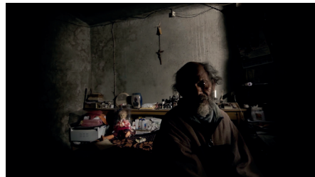
Figura 6. Homem sentado, Cavalo Dinheiro (2014), de Pedro Costa