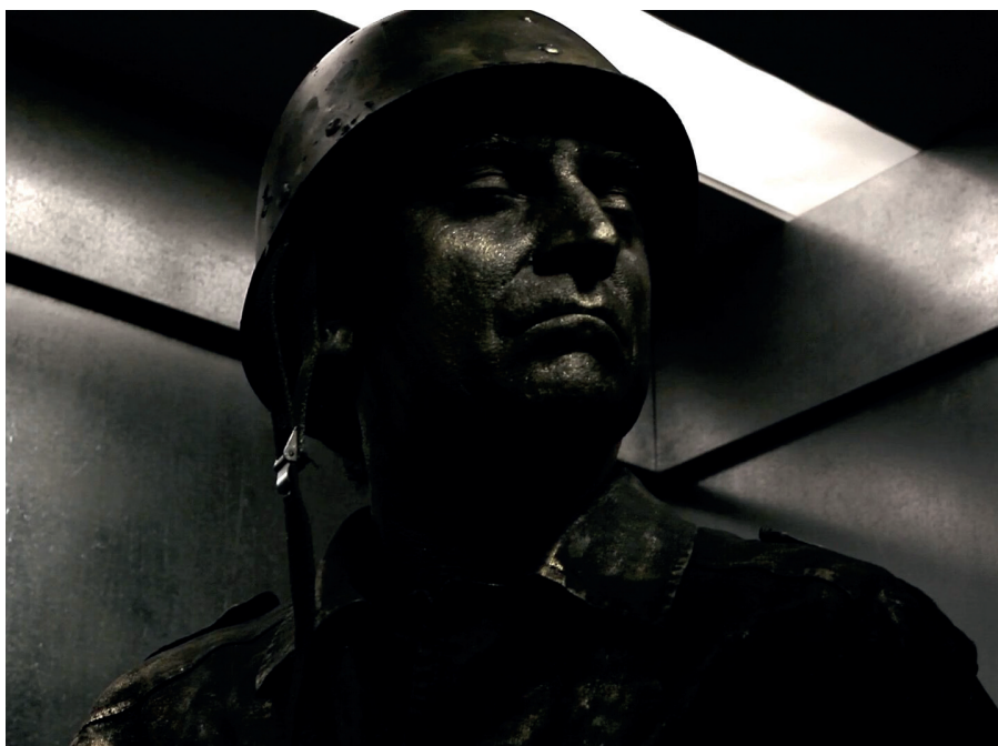
Figura 11. Ventura no elevador, Cavalo Dinheiro (2014), de Pedro Costa