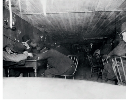
Figura 2. Imigrantes em Nova Iorque fotografados por Jacob Riis (1890)

A abrir Cavalo Dinheiro , vemos fotografias de Jacob Riis (1890) onde figuram trabalhadores imigrantes em Nova Iorque, no final do século XIX. As pessoas fotografadas encontram-se consideravelmente próximas, quase amontoadas. Estas imagens retratam ambientes ruidosos que o tempo cobriu de silêncio; talvez por esse motivo, o autor não achou necessário que algum som as acompanhasse. A sequência das fotografias de Riis culmina no plano do retrato de um homem negro e triste, pintado por Géricault. Estas primeiras imagens, sem som, confundem o filme na história do mundo e o passado no presente, ao mesmo tempo que instituem o tom (elevado/sério) com que o filme revelará a obscuridade de uma parte da história da humanidade. Desde os primeiros momentos, é esta a proposta de Cavalo Dinheiro : mostrar a obscuridade, que é o contrário de iluminar a obscuridade.