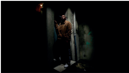
Figura 4. Homem jovem, Cavalo Dinheiro (2014), de Pedro Costa

Ali, el ta trabadja na tchuba na bento (na frio) Na Cuf, na Lisnave e na Jota Pimenta Mon d'obra barato, pa mas q' i trabadja (serventi) Mon d'obra barato, baraca sem luz (cumida a pressa) Inda mas nganadu q' i s' irmon branco (splorado) Mas um dia, que n' volta pa terra Monte Gordo e Malagueta Nhos tem q' i da-m água Cu força na braço, consciencia di mi, E mi q' i trabadja, tera e poder e pa mi Cu sinbrom na cutelo (nos tera) Midju na tchon (nos tera) E barco na porto (nos tera)