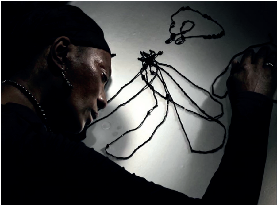
Figura 8. Vitalina, Cavalo Dinheiro (2014), de Pedro Costa