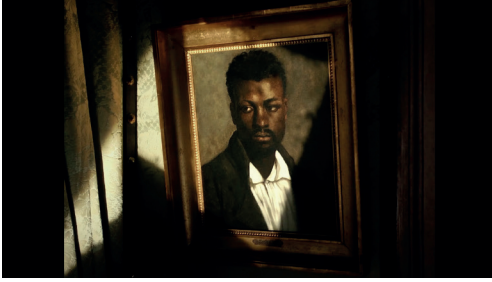
Figura 3. Busto de negro de Gericault em Cavalo Dinheiro (2014), de Pedro Costa

companheiros estrearam em 2006. Porque, se é verdade que Cavalo Dinheiro conta uma parte da história universal, também é verdade que o filme se alimenta da memória dos filmes feitos por esta mesma equipa e que o precederam, bem como das circunstâncias particulares destes imigrantes, desta comunidade específica e deste país que é Portugal. Mais tarde, sensivel-