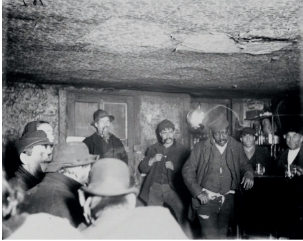
Figura 1. Imigrantes em Nova Iorque fotografados por Jacob Riis (1890)

Há fotografias de nitidez, estas são obscuras. São feitas por mim, segundo a minha vontade. Jaime (1974), de António Reis