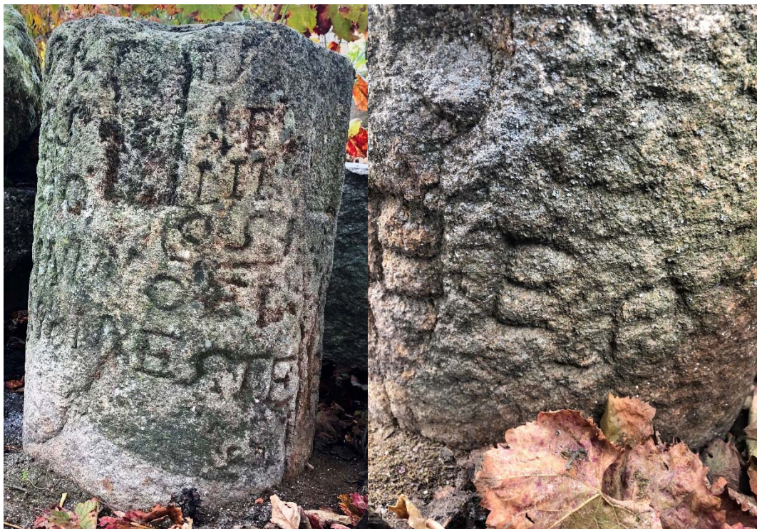
Figura 8 – O letreiro do peso de lagar 2.

Na linha 1: antes do rasgo, S bastante inclinado para diante; depois do rasgo, outro S , embora também se nos ocorra ler DOS .