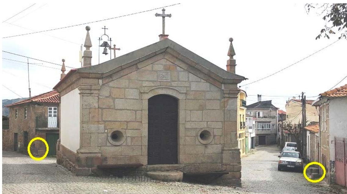
Figura 9 – Capela do mártir São Sebastião.

Essa sugestão também poderia ser dada pelos marcos que ladeiam a Capela do mártir São Sebastião (Figuras 9, 10 e 11).