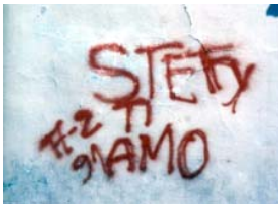
Figura 2 - Grafito em Perugia.