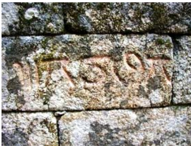
Figura 4 – Inscrição enigmática.

E que dizer do que está gravado numa pedra deste muro (Figura 4), cuja localização, por negligência, não registámos?