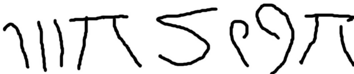
Figura 5 – Desenho da inscrição enigmática.

Quem no-lo comunicou teve o cuidado de apresentar desenho (Figura 5). Olha-se; inverte-se a imagem na horizontal, não vá o escriba ter posto a legenda às avessas, à imitação de Leonardo da Vinci.