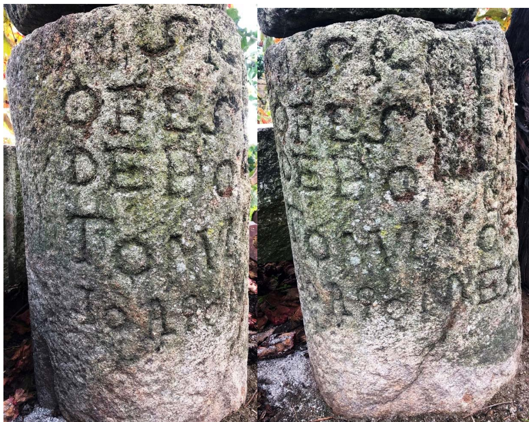
Figura 7 – O letreiro do peso de lagar.

Analisemos, pois, o que se nos afigura ler, partindo do princípio, como atrás se disse, de que é posterior no peso o corte em cauda de andorinha para assentamento do apoio do fuso ligado à vara do lagar. Agrupámos as imagens duas a duas nas figuras 7 e 8, a fim de melhor se poder seguir a descrição.