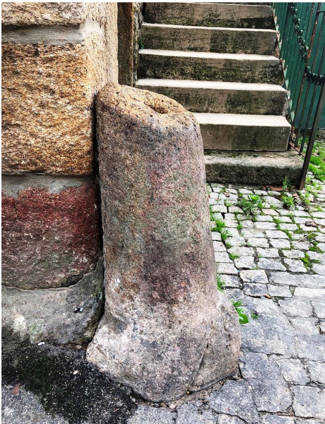
Figura 11 – Uma coluna.

Não é essa, porém, a nossa interpretação: embora uma delas, pela sua forma (a base), possa ter sido miliário romano, ainda que anepígrafo, terão sido aproveitadas quer para proteger os ângulos da capela quer para delimitar – como é de lei – o espaço pertencente à sua “fábrica”.