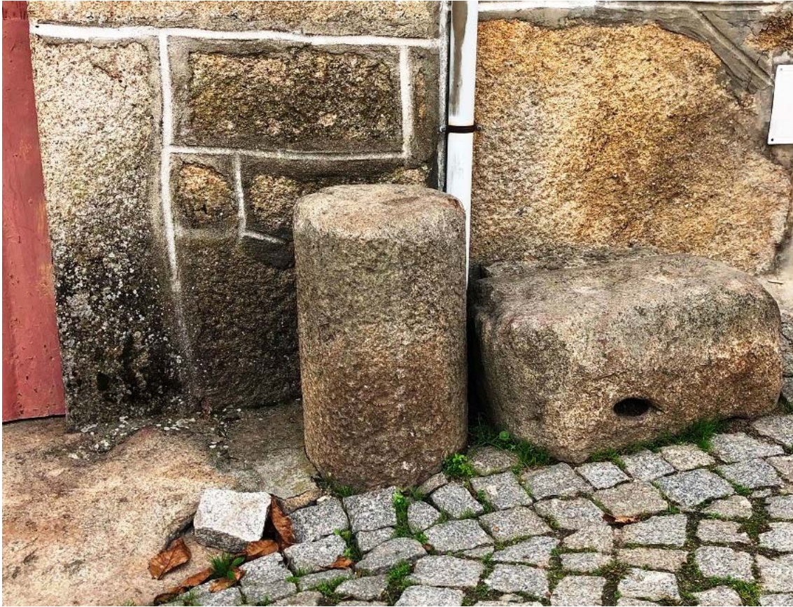
Figura 10 – Uma coluna.