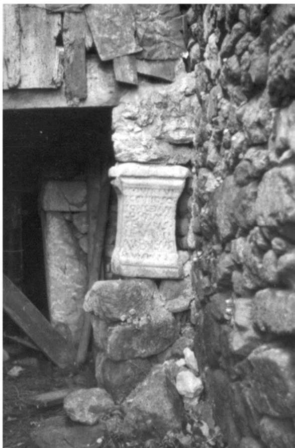
Figura 1 – Altar romano utilizado como coluna.

daquele telheiro ostenta inscrição antiga Figura 1 e é uma ara romana (Gomes & Tavares, 1985);