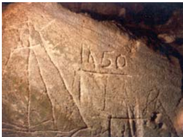
Figura 3 – Desenho numa gruta das Baamas.

E, a propósito de datas, se poderá contar a história duma inesperada ida às Baamas, em Maio de 1989. Um grupo de ornitólogos ingleses, entusiastas da observação das aves, entrou numa gruta, para onde bonita ave se escapulira. E deram com estranho desenho de navio com a data de 1460 grafada ao lado (Figura 3).